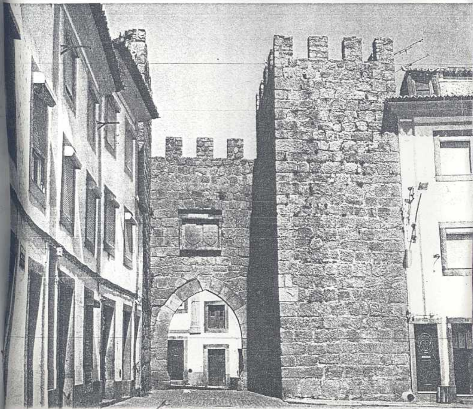
O Arco da Vila, em Nisa

Quem se deslocar de Sousel não poderá deixar de visitar os seus solares, a Igreja de N.ª S.ª da Orada, a Igreja Matriz, do século XVI, e a Igreja da Misericórdia. A Feira de S. Miguel tem lugar a 29 de Setembro. A 4 de Abril a vila festeja a S.ª do Campo da Serra e a 15 de Agosto a S.ª da Graça.