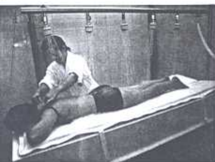
No ano passado, verificou-se um aumento considerável das inscrições em tratamento termal.

...dias nas termas. Relaxar e deixar-se envolver pela água é a razão mais do que suficiente para esquecer a confusão e desfrutar de uns dias de descanso.