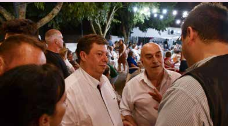
XXX Festival de Folclore de Nisa