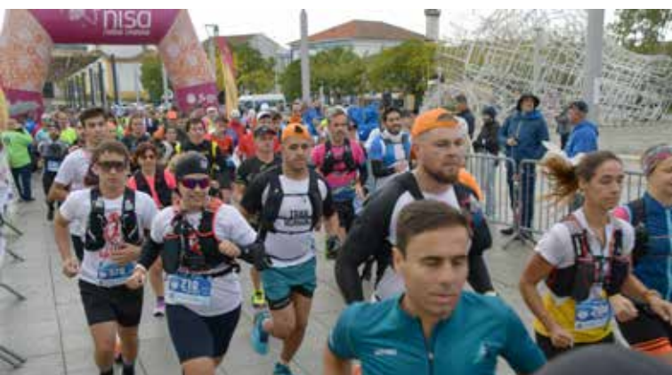
IX Trail Running Vila de Nisa