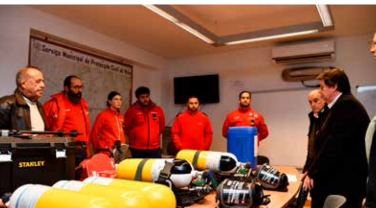
Entrega de equipamentos aos Bombeiros