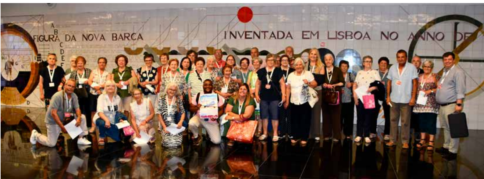
Saída do Aeroporto de Lisboa

Por isso, promovemos uma iniciativa inédita – um “batismo de voo” - inserida no programa CLDS5G NisAjuda+, um momento marcante na vida de dezenas de idosos com mais de 65 anos que tiveram a oportunidade única de andar de avião, numa viagem entre Lisboa e o Porto, concretizando um sonho até então inalcançável.