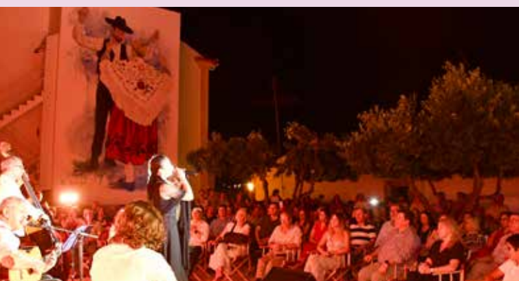
Recital de Fado na Casa das Memórias