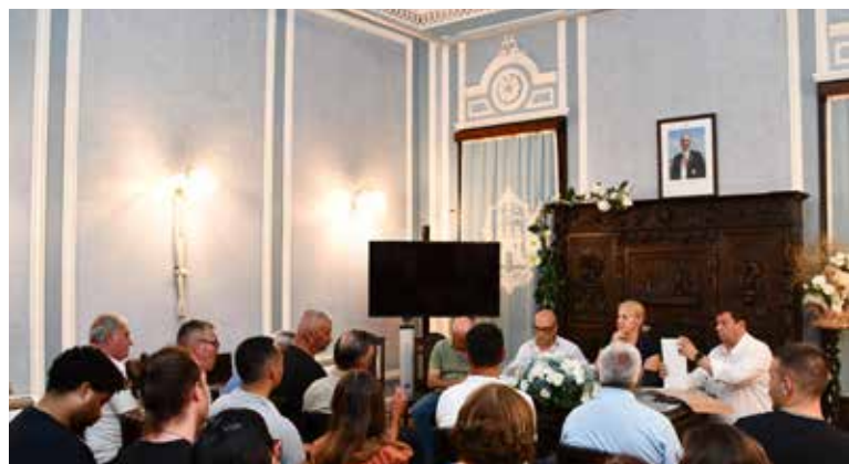
Entrega de subsídios às associações