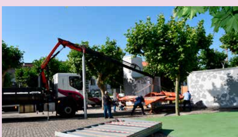
Montagem do "Nisa em Festa"