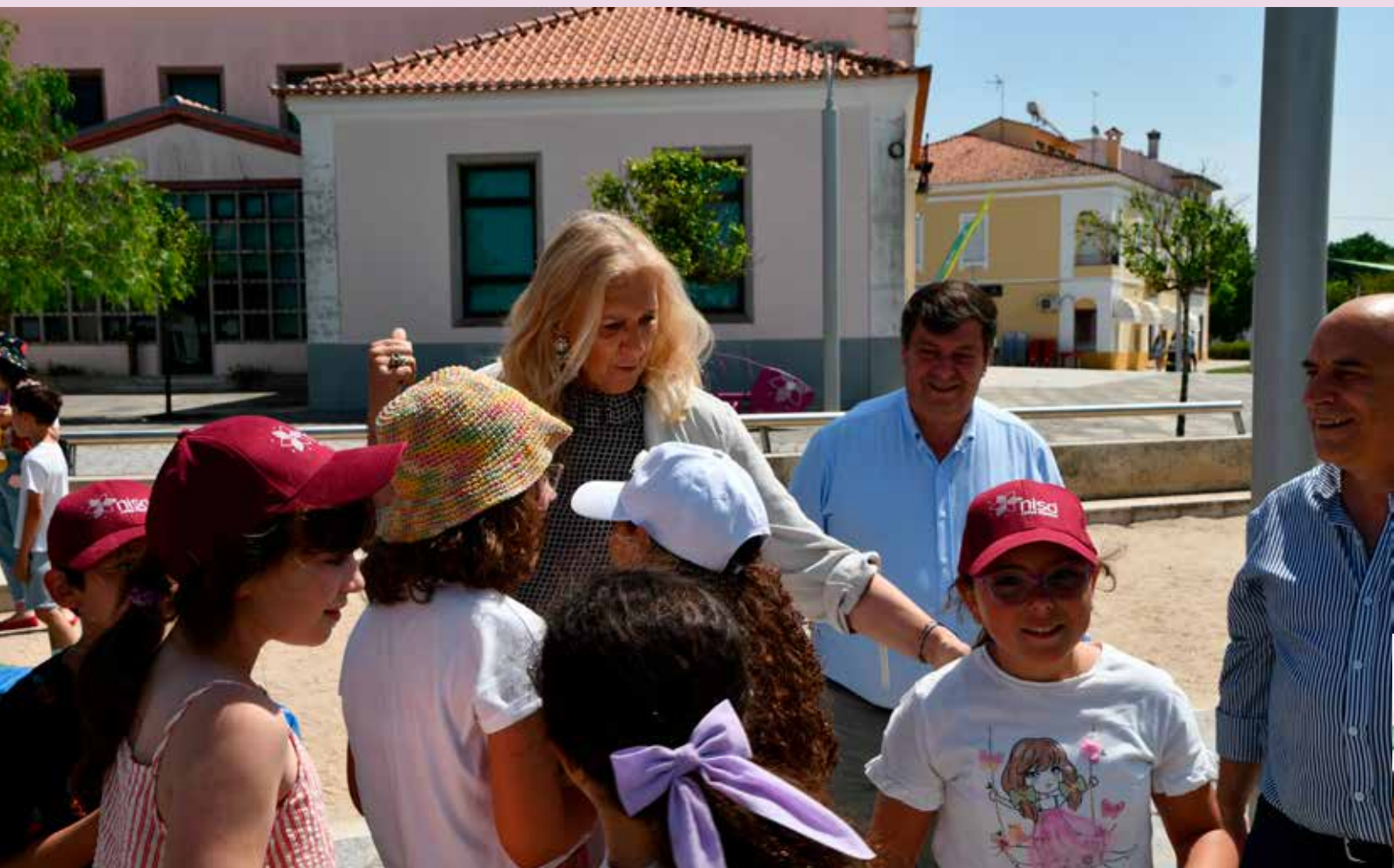
Comemoração do Dia Mundial da Criança com várias atividades