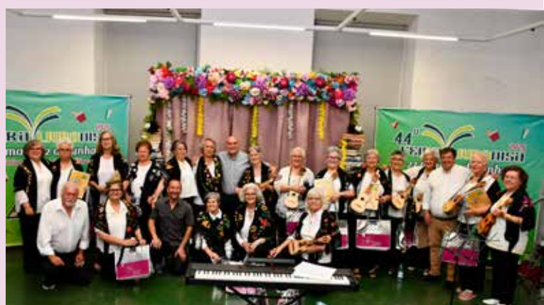
Turma de Música da Universidade Sênior