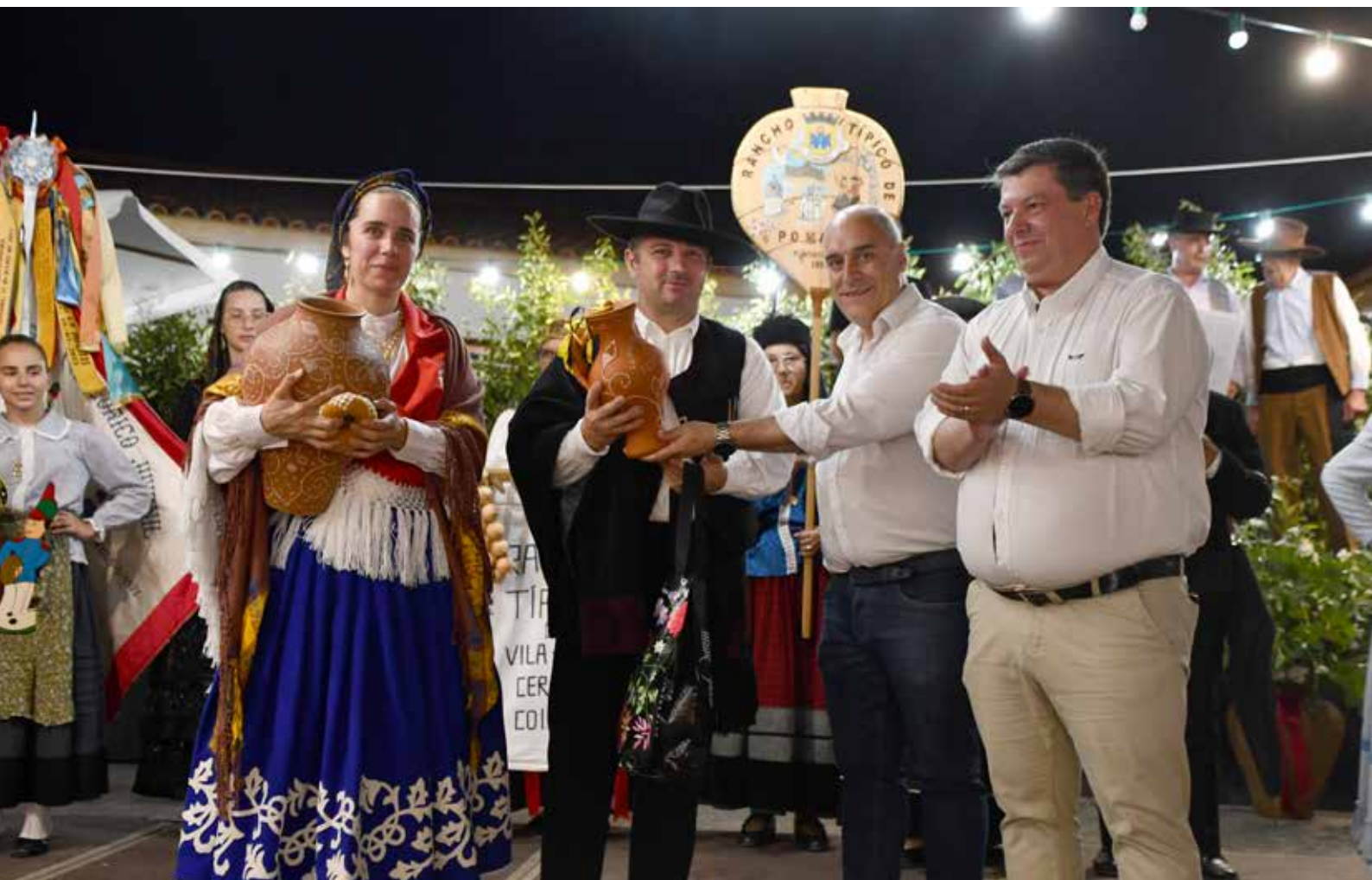
XXX Festival de Folclore de Nisa junto ao Centro de Artes & Ofícios