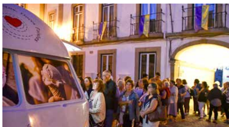
Oferta de gelados caseiros