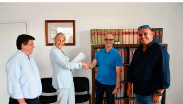
Escritura de venda de Lotes para Unidade Fabril

Esta dinâmica tem sido tão positiva que os projetos que atingiram maturidade cedem agora o seu espaço a novas iniciativas, comprovando que a incubadora cumpre o seu propósito: permitir que as empresas cresçam e encontrem no concelho as condições para consolidar o seu futuro.