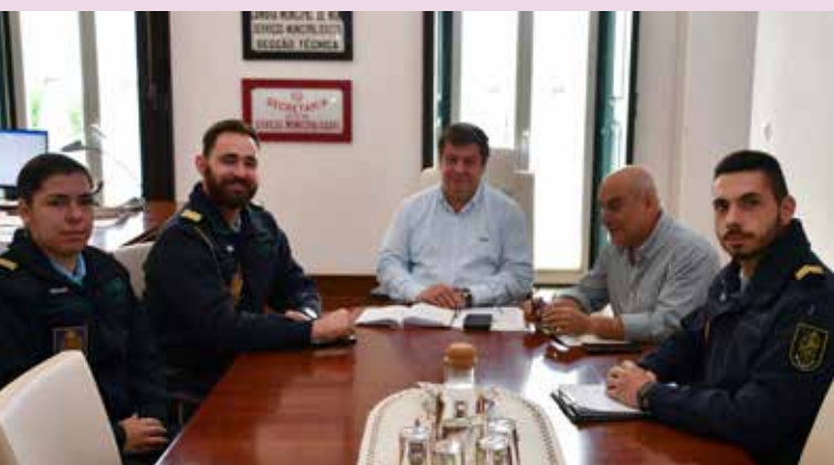
Comandante do Destacamento Territorial da GNR de Nisa