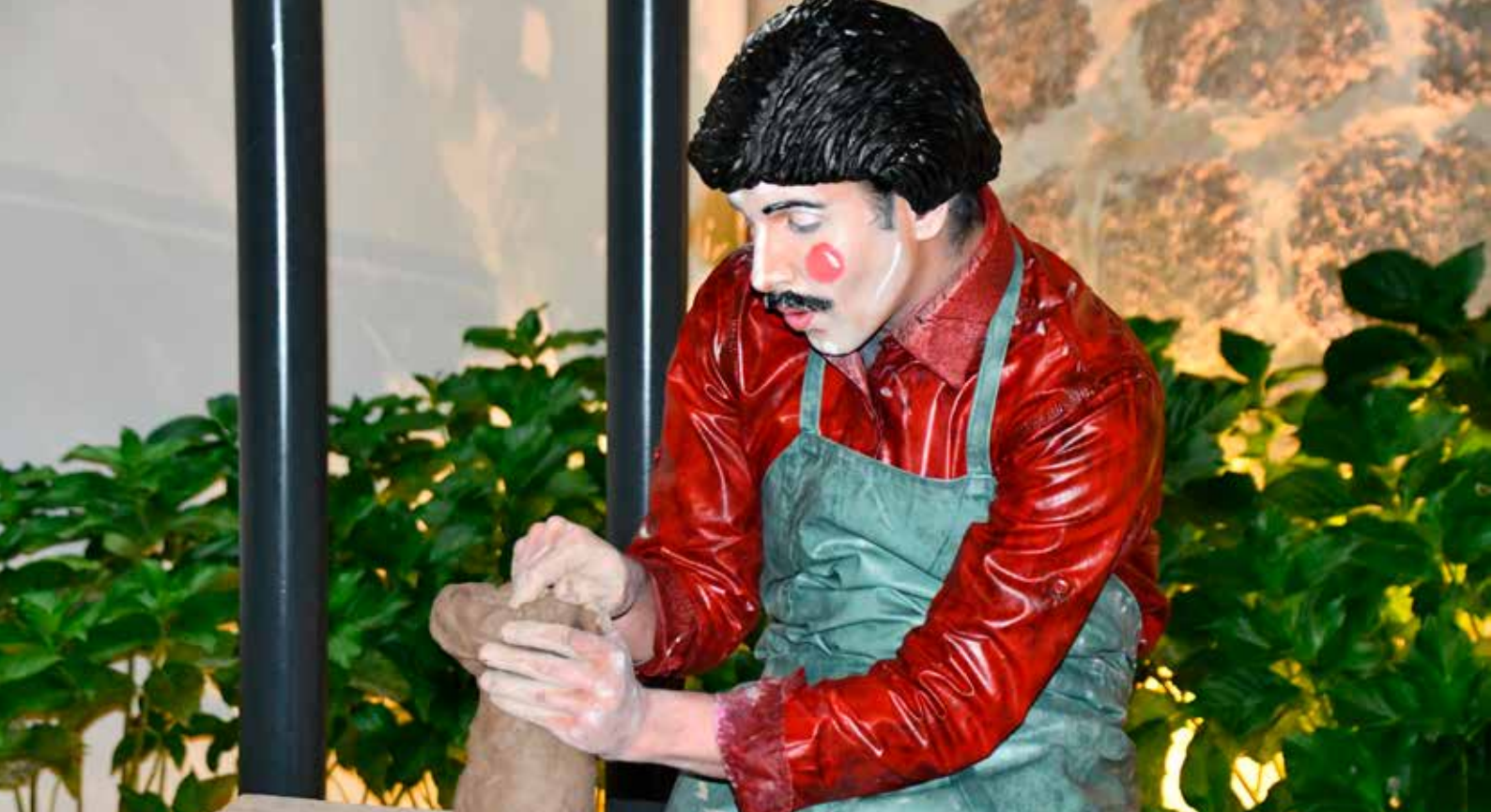
Estátua do oleiro na roda