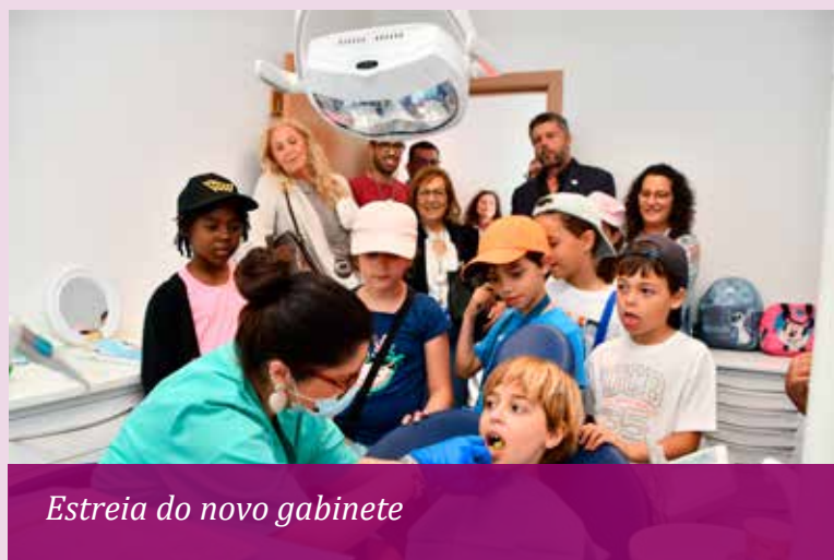
Estreia do novo gabinete