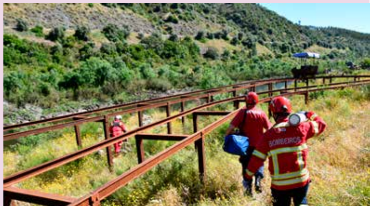
Exercício com os Bombeiros Voluntários de Nisa