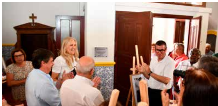
Inauguração da obra