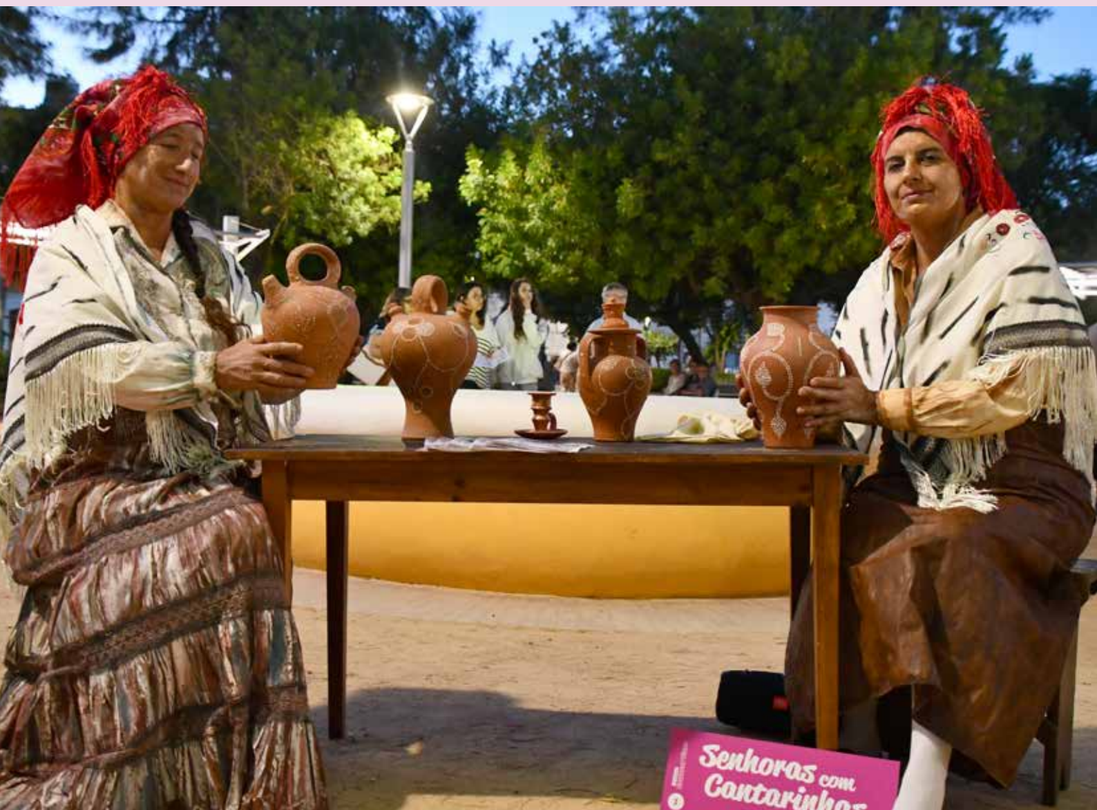
Pedradeiras com Cantarinhas no Jardim Municipal