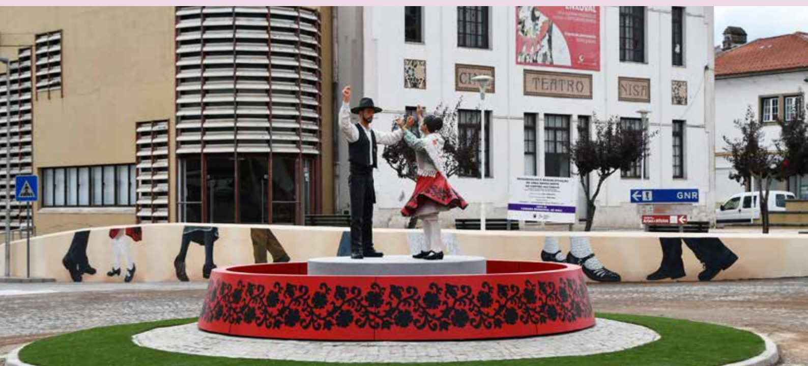
NISA - Nova rotunda homenageia o folclore e tradição nizorra

Continuamos a desenvolver, de forma contínua, um vasto conjunto de obras em todo o Concelho, reforçando o nosso compromisso com a melhoria das infraestruturas, da qualidade de vida e da coesão territorial, através de intervenções que assumem uma importância estratégica na construção de um território mais atrativo, dinâmico e preparado para os desafios do futuro.