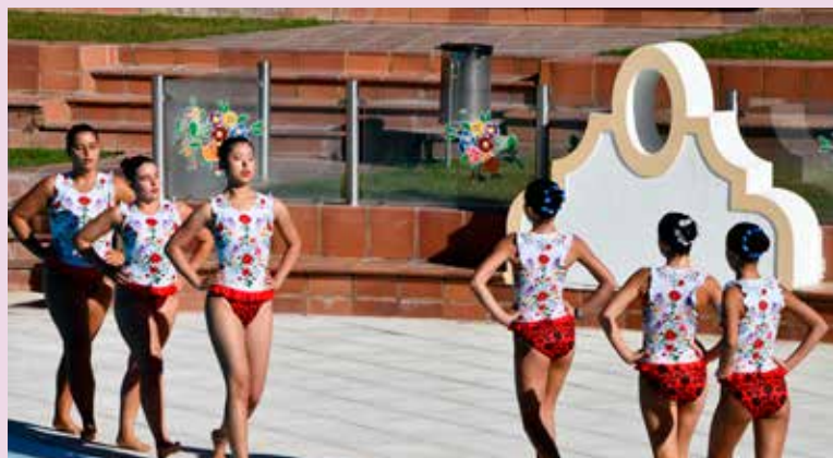
Fatos de banho identitários