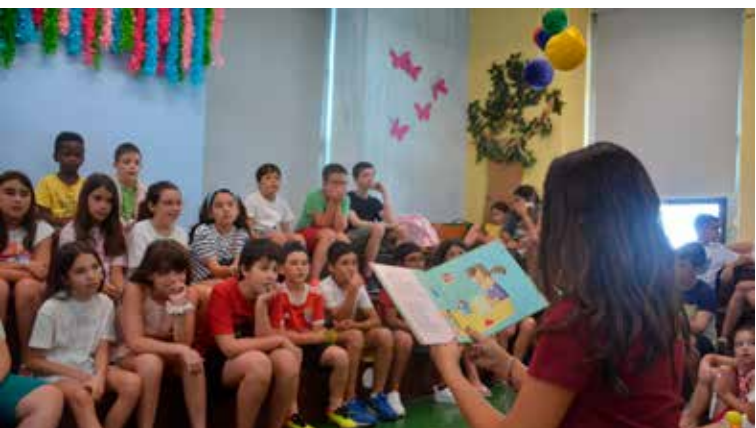
Leitura partilhada de poemas