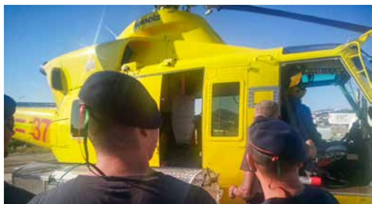
Formação com Helicóptero de socorro