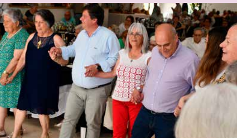
Dança e convívio