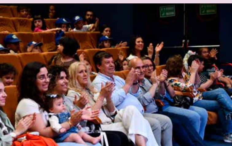
Sessão de Teatro