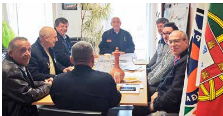
Reunião de trabalho - apresentação do projeto conceptual de arquitetura