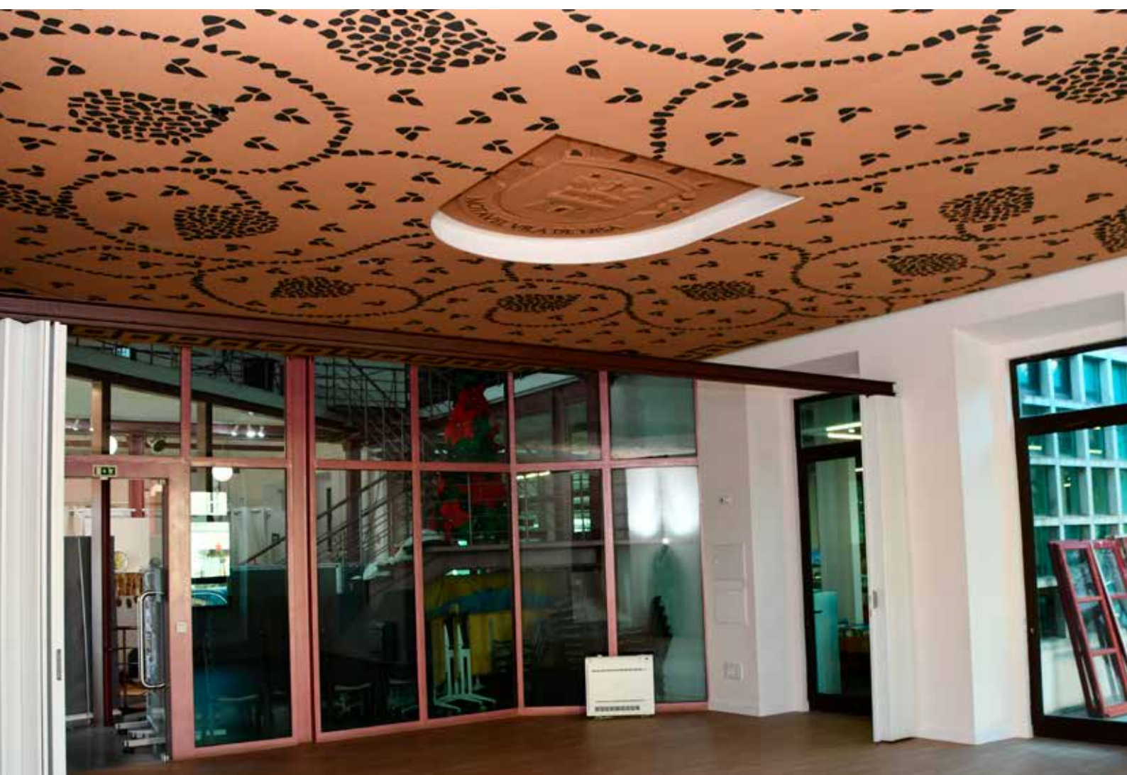
NISA - Eficiência Energética em Edifícios Municipais - Biblioteca Municipal Valor contratado: 69.493,77€