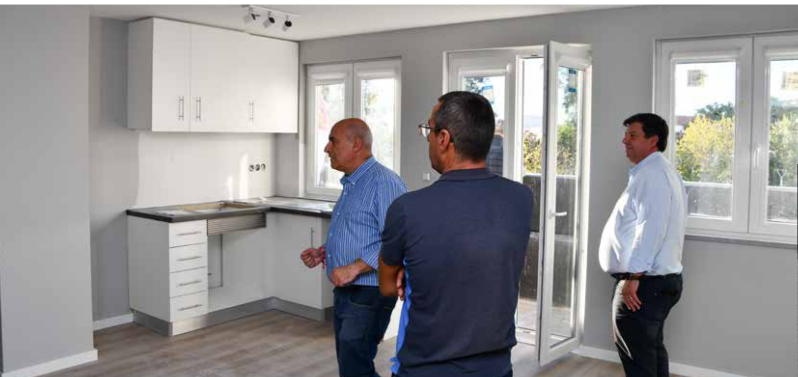
NISA - Reabilitação de Edifício na Praça da República Casa do Isaac Valor Contratado: 656.693,40 €