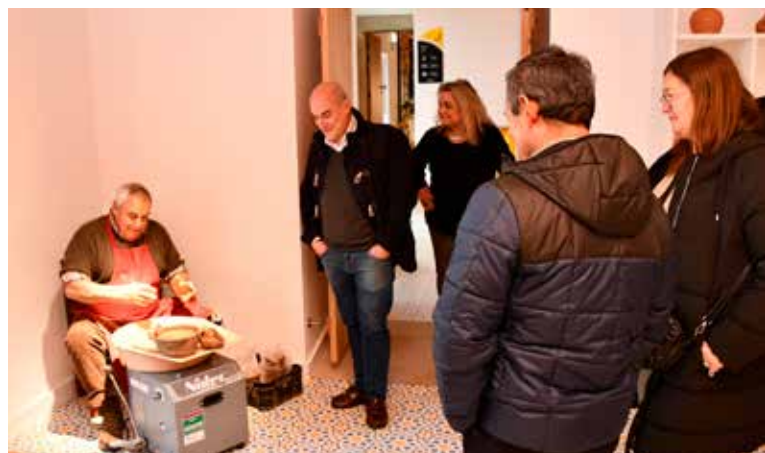
Roteiros de Natal Casa das Memórias