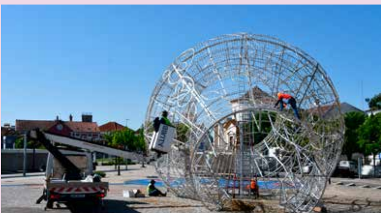
NISA – Manutenção da Bilha Iluminada