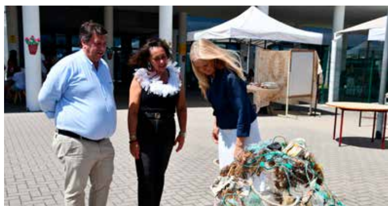
Atividades do programa EcoEscolas