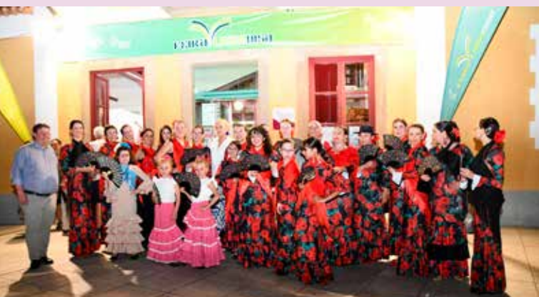
Grupo de Sevillanas Essência Rociera