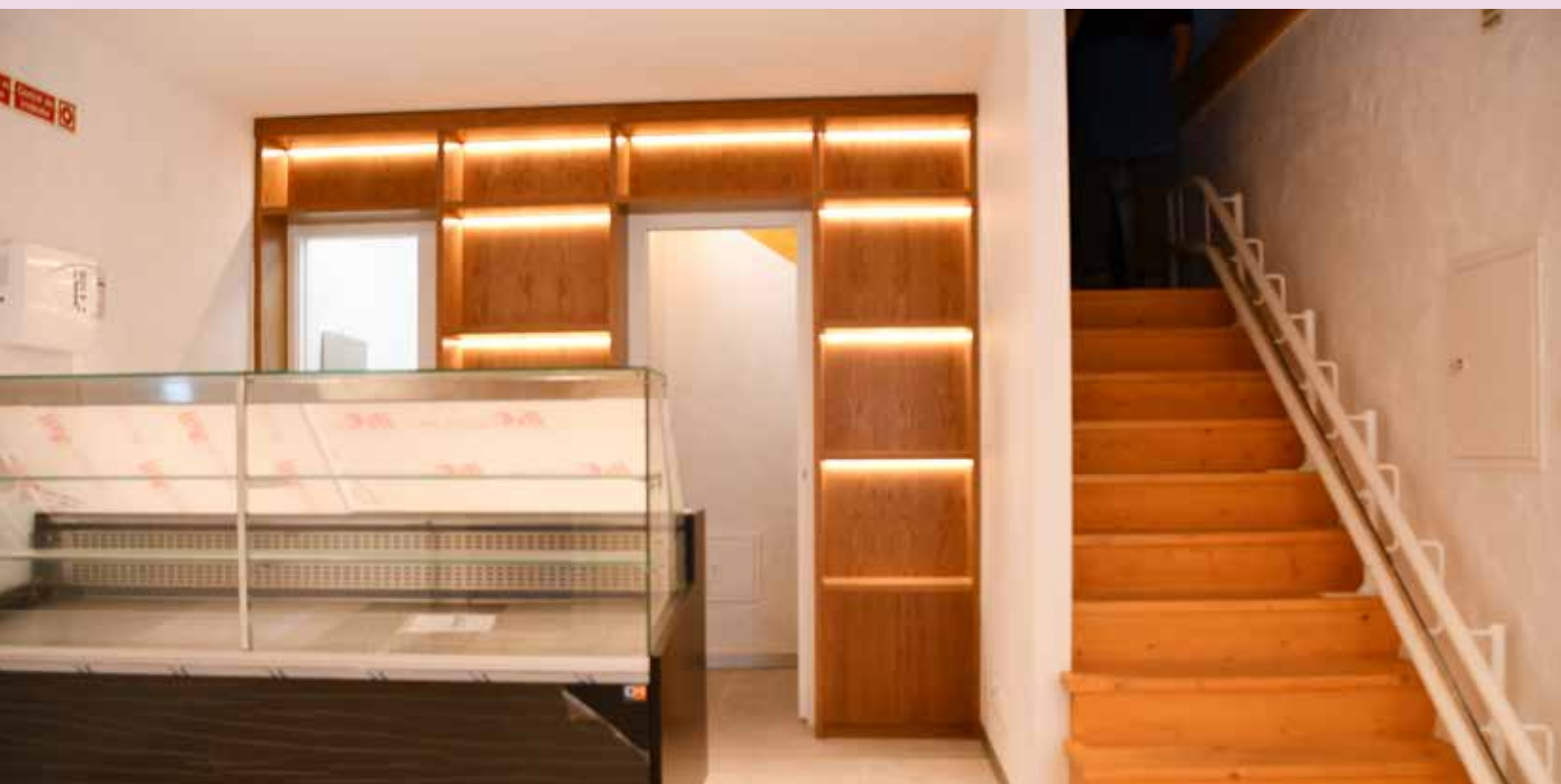
NISA - Casa dos Bolos Rua António Lobo da Silveira nº29 e 31 Valor Contratado: 204.370,58 €