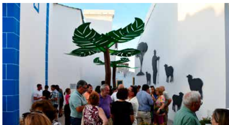
Inauguração da obra