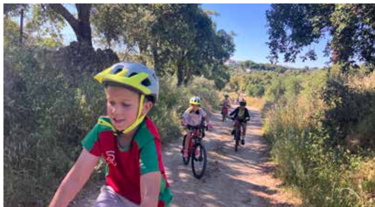
Passeios de Bicicleta