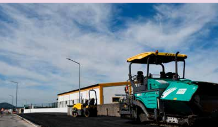
NISA – Beneficiação de arruamentos na ZAE