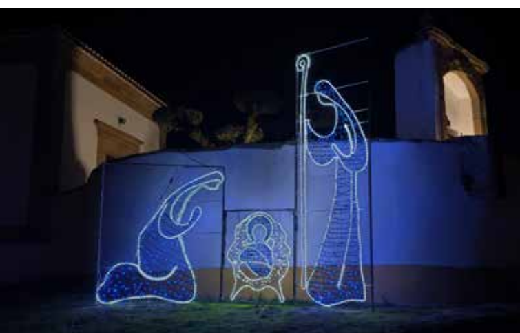
ALPALHÃO Iluminação junto ao Calvário