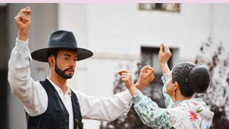
Nova rotunda (pormenor)