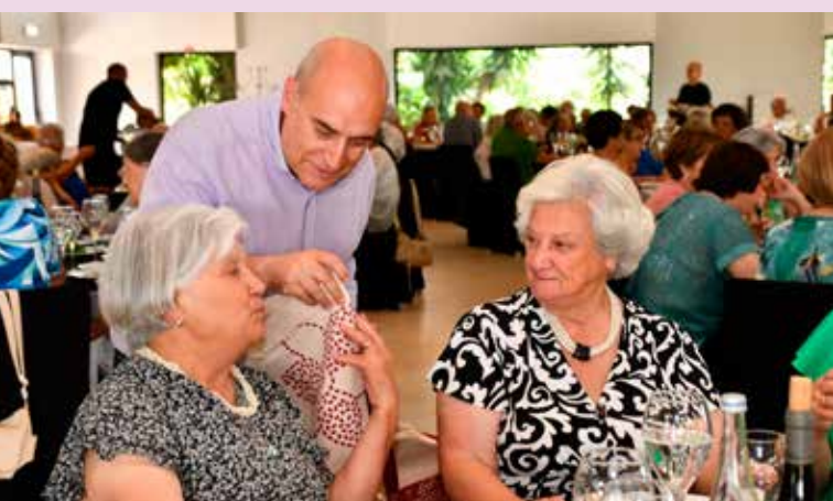
Oferta de brindes