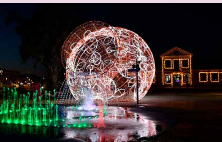
Iluminações de Natal Praça da República