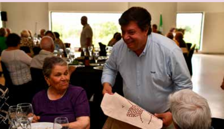
Oferta de brindes