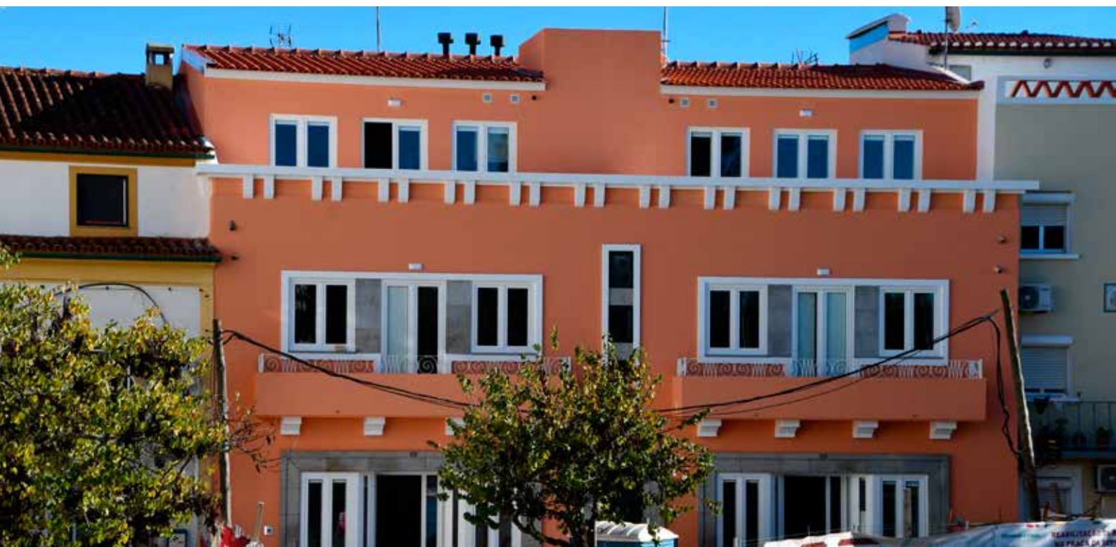
NISA - Reabilitação de Edifício na Praça da República Casa do Isaac Valor Contratado: 656.693,40 €