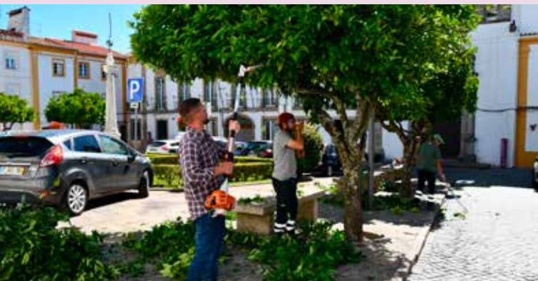
Limpeza de árvores na Praça do Município