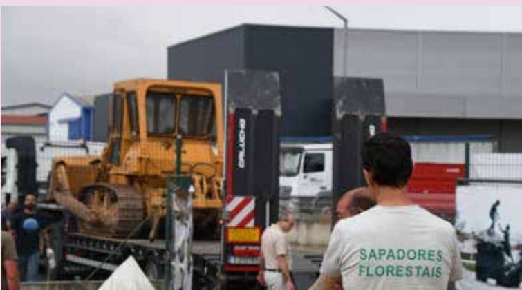
Receção de Máquina de Rasto