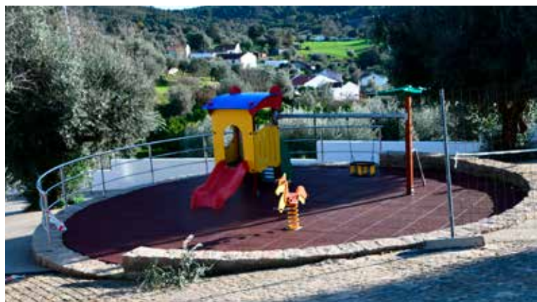
AMIEIRA DO TEJO - Requalificação da Tapada do Chão de Alter