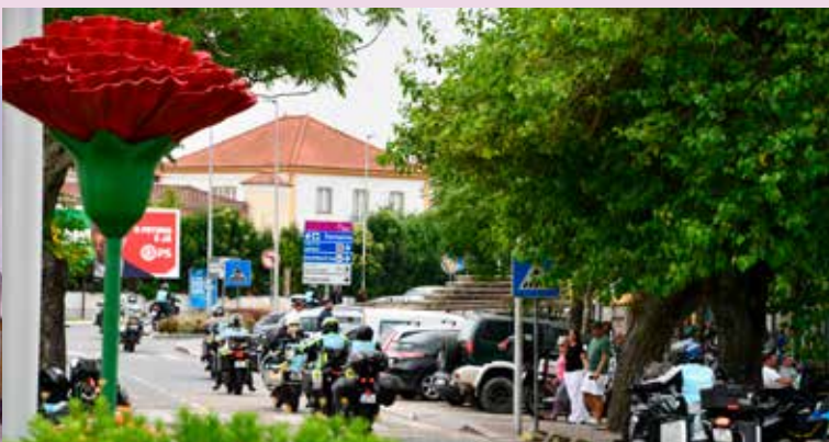
“Portugal Lés-a-Lés” na Praça da República

Com espaços requalificados e ruas cheias de identidade, Nisa revelou-se um lugar de descoberta e bem-estar, reforçando a sua posição como paragem obrigatória no panorama do turismo nacional.