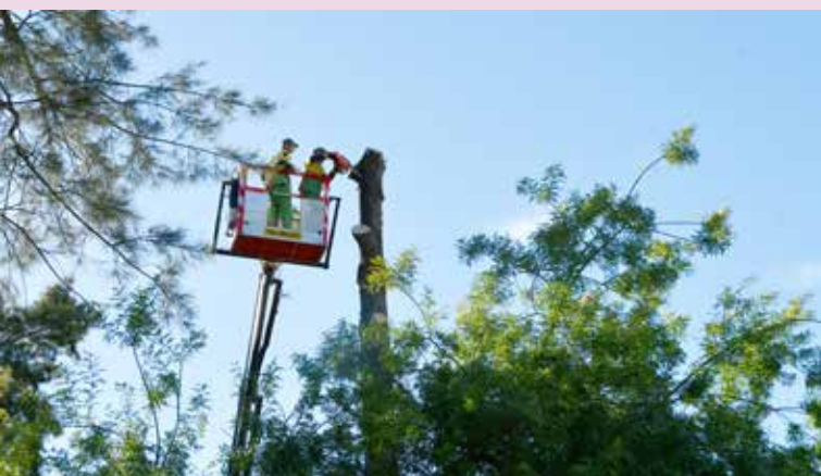
NISA – Corte e Substituição de Árvores no Jardim Municipal