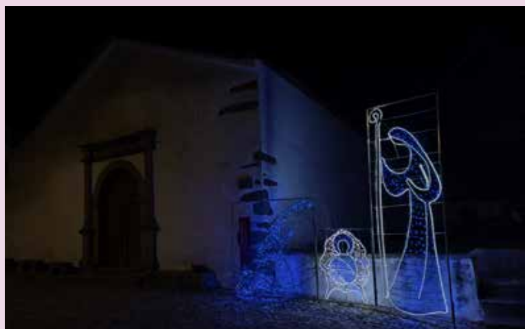
CACHEIRO Iluminação junto à Igreja Matriz