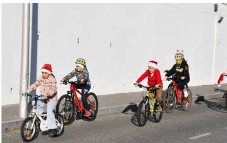
Passeio de Pais Natal em Bicicleta