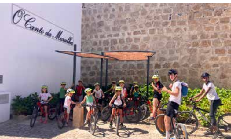
Passeios de Bicicleta