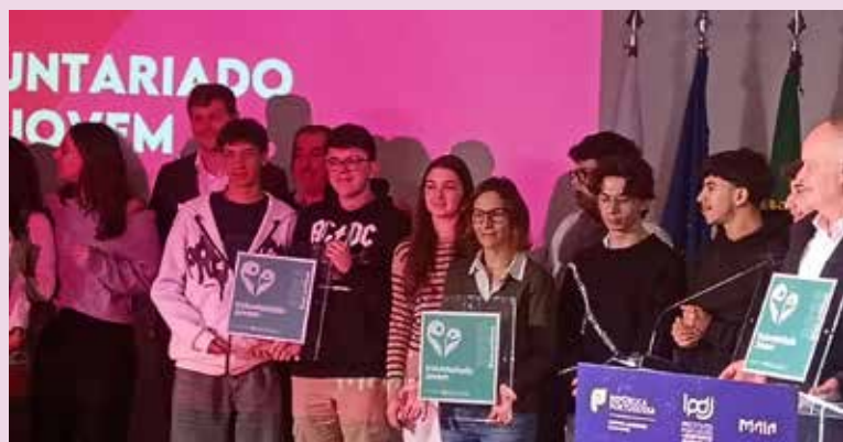
Prémio de Boas Práticas de Voluntariado