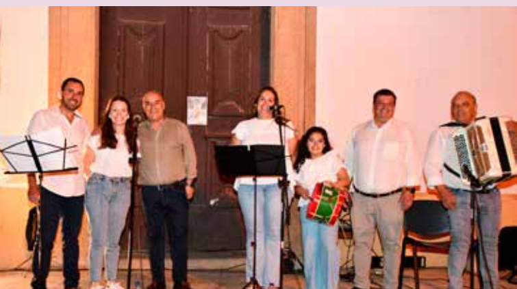
Música tradicional da Igreja Matriz