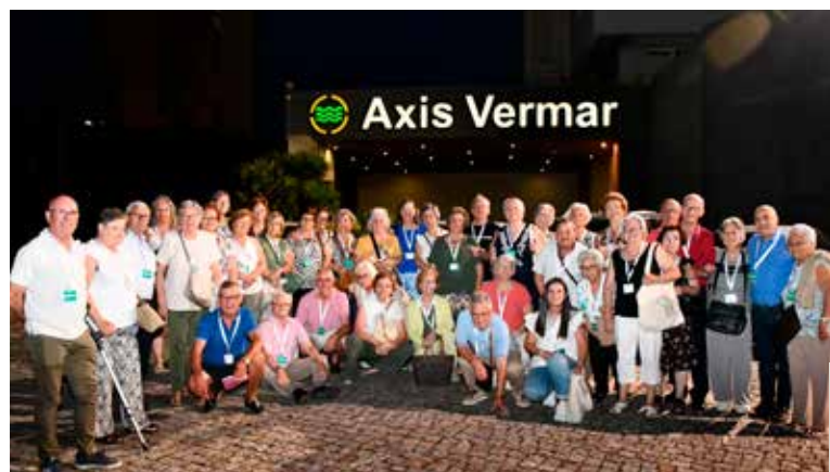
Chegada ao hotel na Póvoa de Varzim