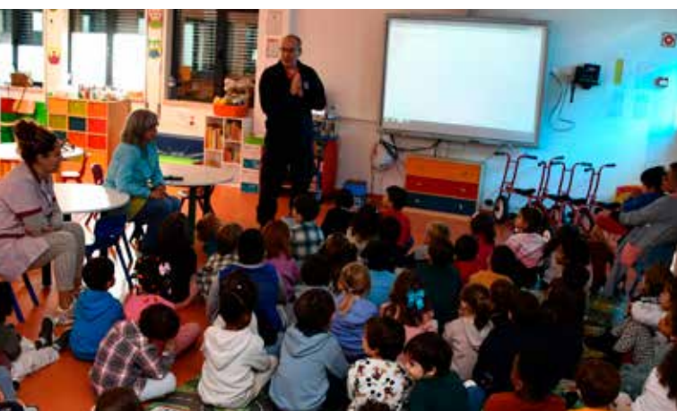
Exercício "A Terra Treme"