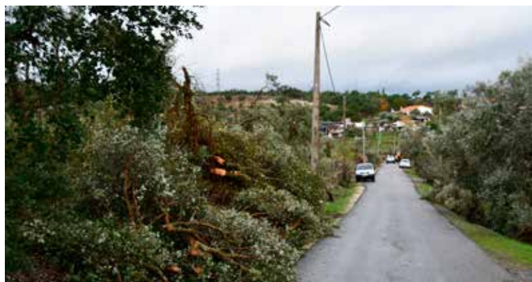
Estragos do Tornado na Falagueira