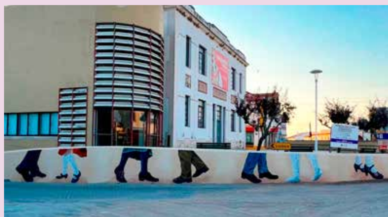
NISA – Pintura de Mural junto ao Cine-Teatro de Nisa