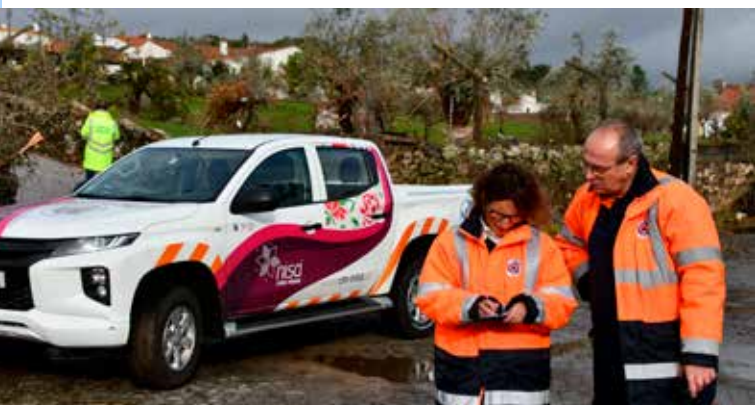
Estragos do Tornado na Falagueira