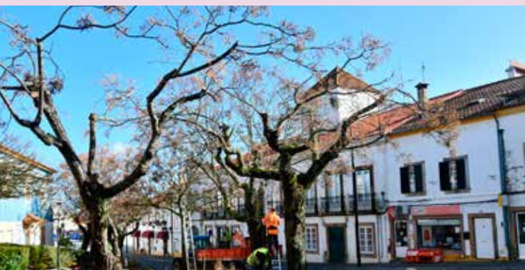
Limpeza de árvores na Rua Júlio Basso