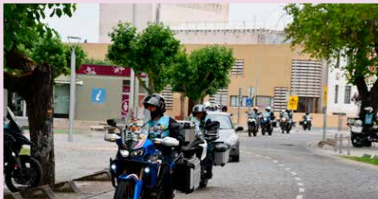
“Portugal Lés-a-Lés” na Praça da República