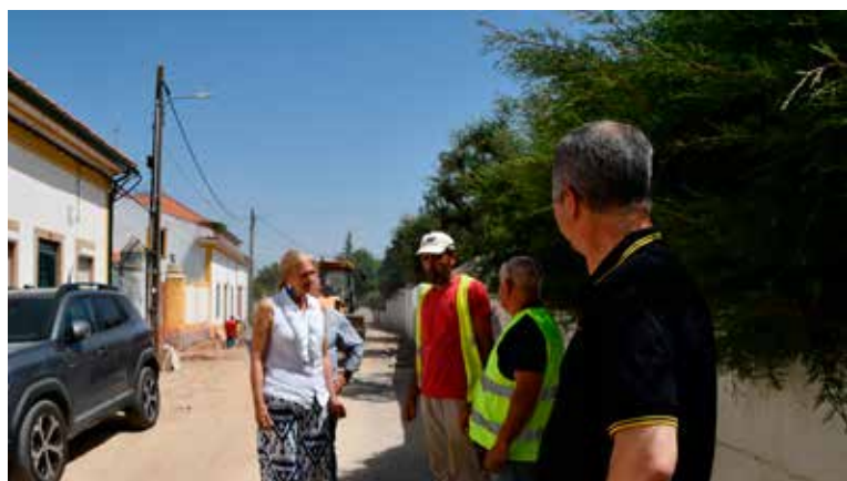
NISA – Beneficiação da Rua Dr. Manuel de Arriaga