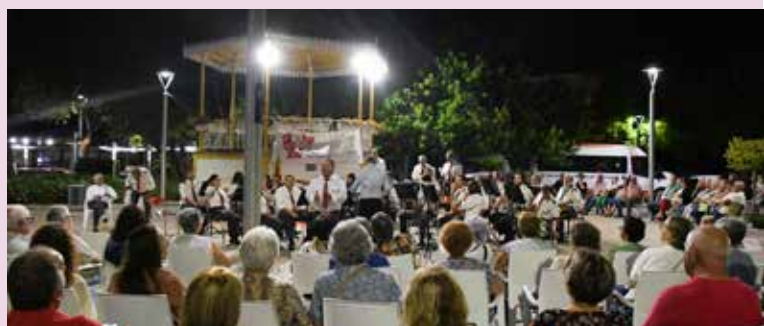
Rota dos Coretos em Nisa