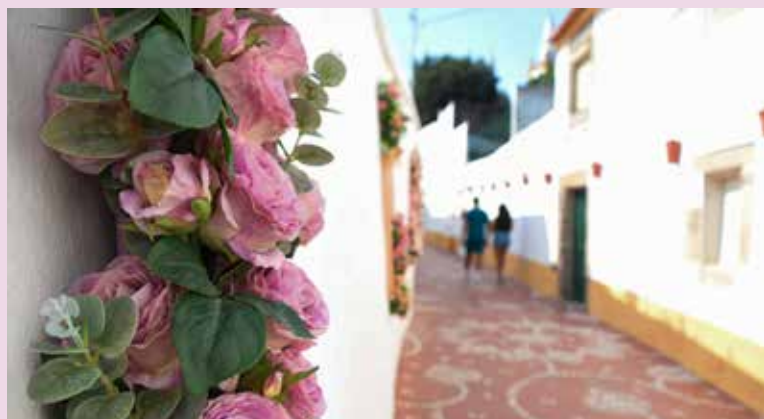
Janelas florais na Rua de Santa Maria