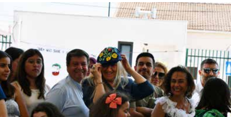
Desfile de moda identitário