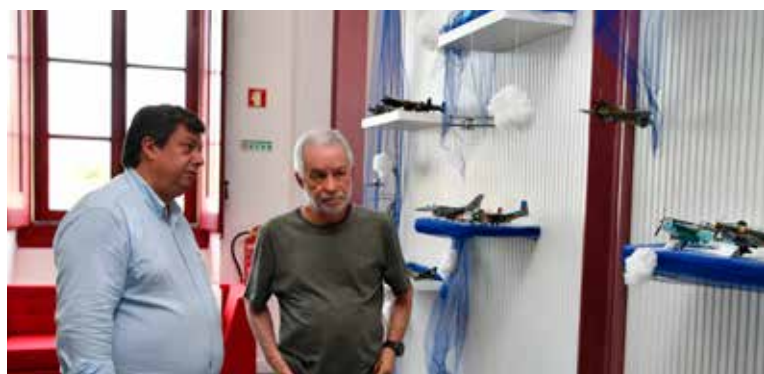
Exposição “Modelos de Aviões em Miniatura”