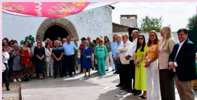
III Feira do Mel em Montalvão