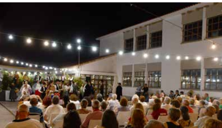
XXX Festival de Folclore de Nisa