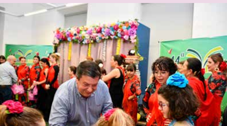
Grupo de Sevillanas Essência Rociera