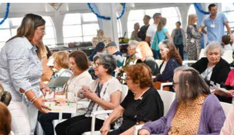
Atividades no Mercado Municipal