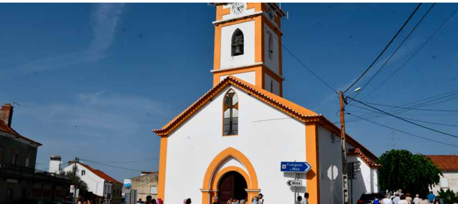
AREZ - Alteração da cobertura da Igreja Matriz Valor Contratado: 121.997,05€