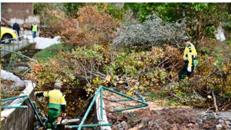
Estragos do Tornado na Falagueira