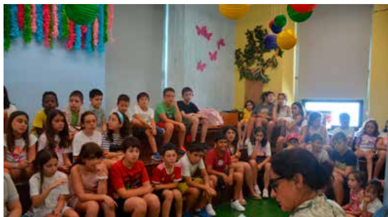
Leitura partilhada de poemas