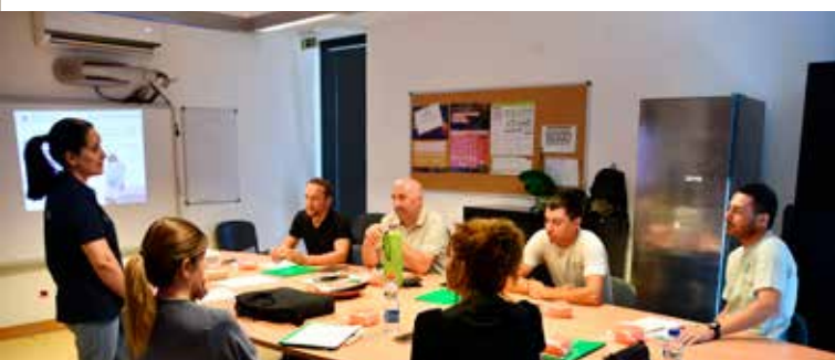
Formação em Suporte Básico de Vida