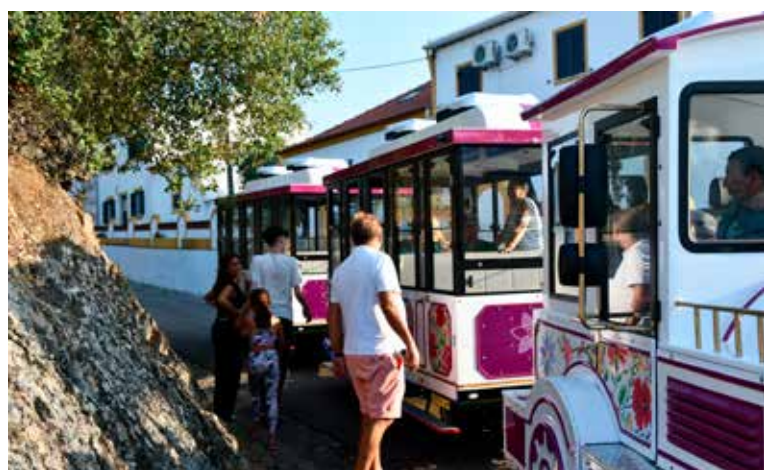
Comboio Turístico nas Freguesias Pé da Serra