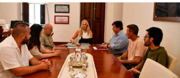
Assinatura de Contratos de Trabalho