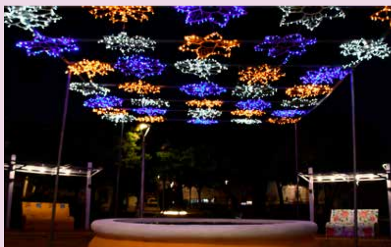
Iluminações de Natal Jardim Municipal de Nisa