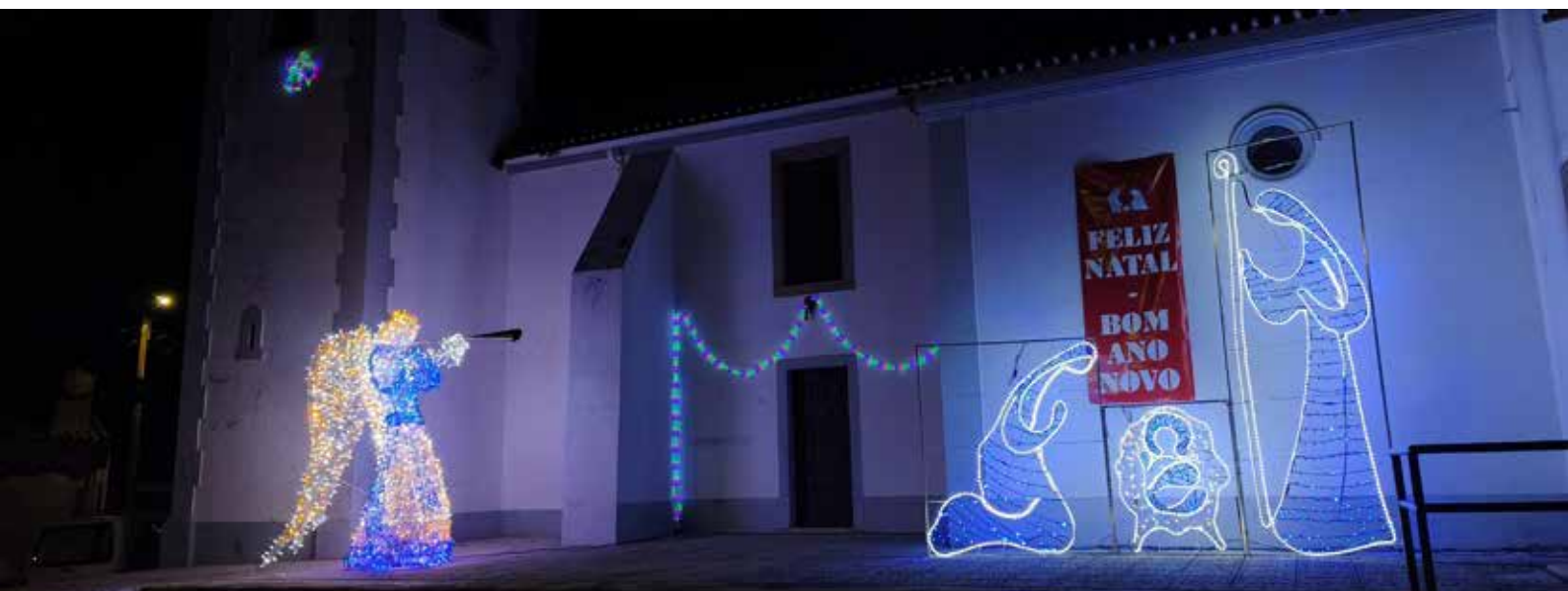
TOLOSA Iluminação junto à Igreja Matriz