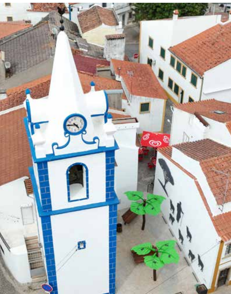
TOLOSA - Requalificação da Envolvente à Torre do Relógio Valor Contratado: 79.658,70€