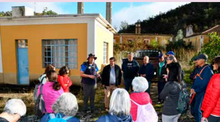
PR3 - "Olhar sobre a Foz"