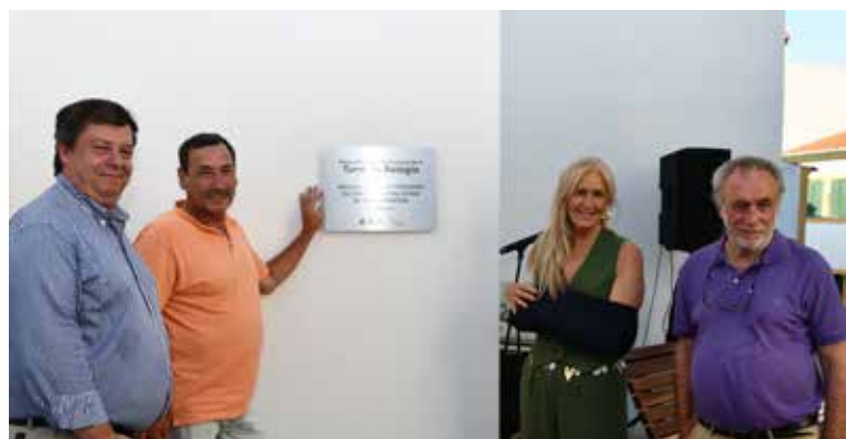
Inauguração da obra