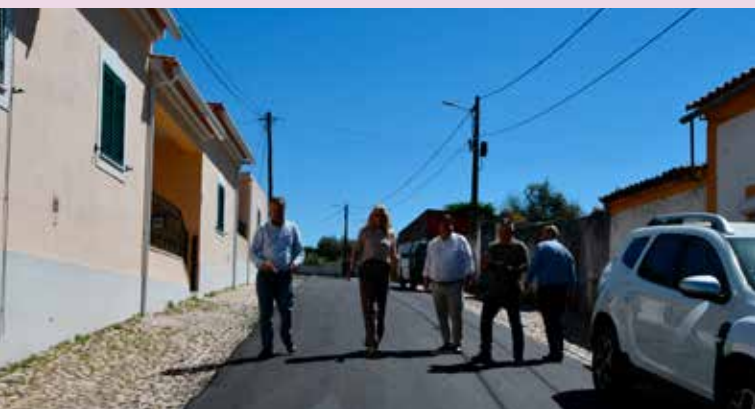
TOLOSA – Beneficiação da Rua de Abrantes