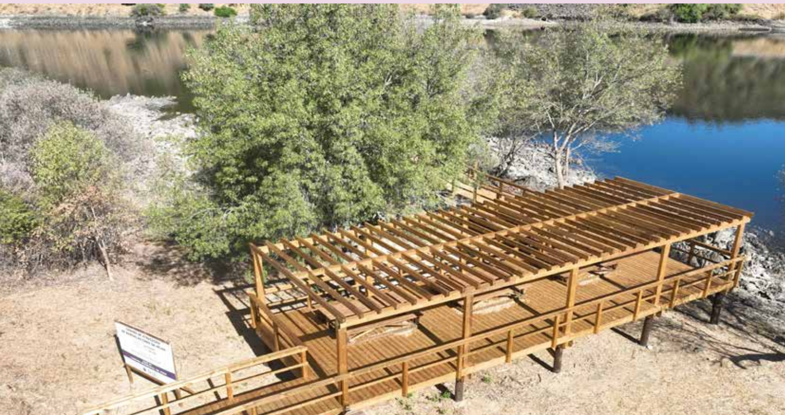
SÃO MATIAS - Requalificação do Cais do Chão da Velha Valor Contratado: 156,650.44€