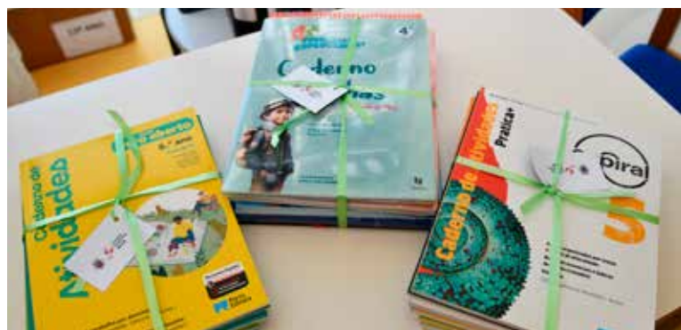
Cadernos de atividades escolares