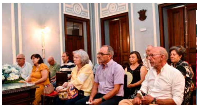
Entrega de subsídios às IPSS's