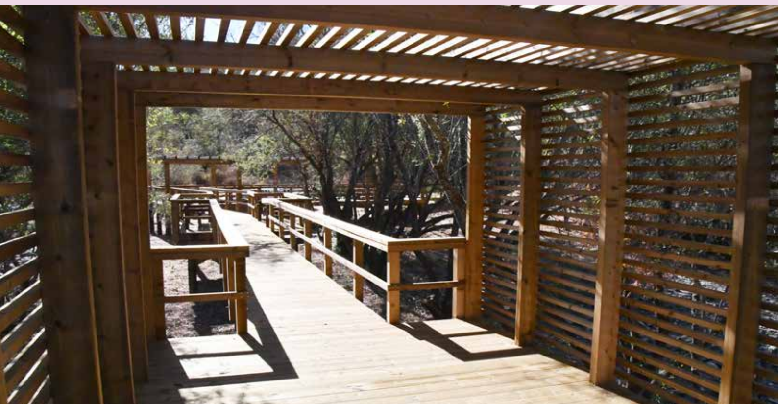
SÃO MATIAS - Requalificação do Cais do Chão da Velha Valor Contratado: 156,650.44€