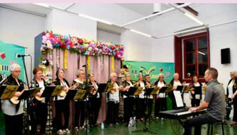
Turma de Música da Universidade Sênior