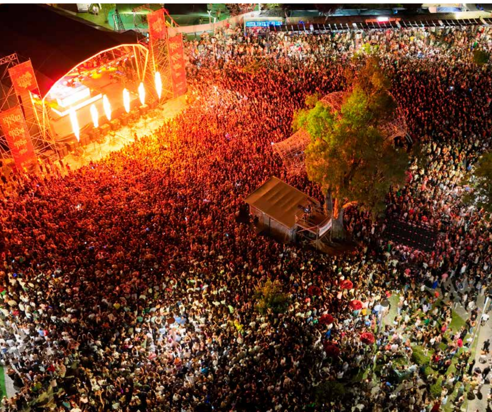
Multidão no Nisa em Festa

Mobilizámos a economia, promovemos o nosso território e mostramos, juntos, que Nisa sabe receber e celebrar como poucos.