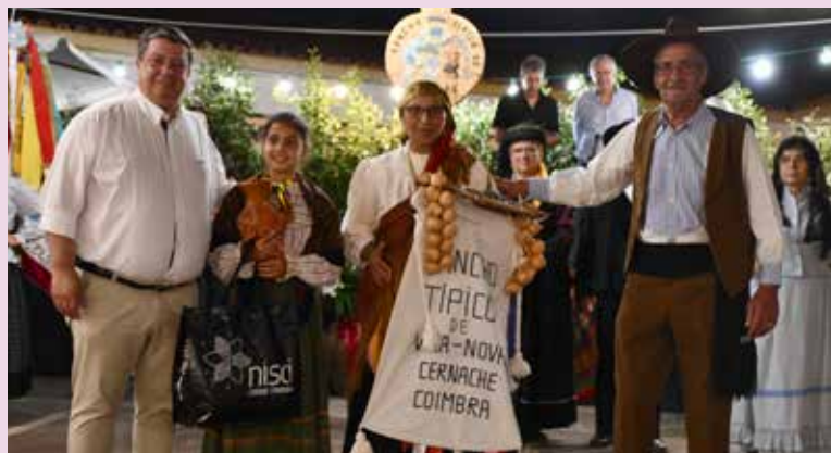
XXX Festival de Folclore de Nisa