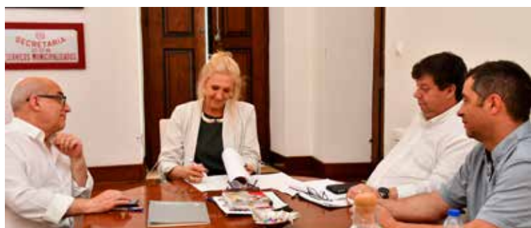
Assinatura de Contrato de Trabalho