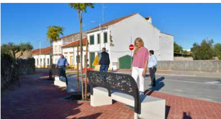
NISA – Criação de estacionamento na Rua da Fábrica