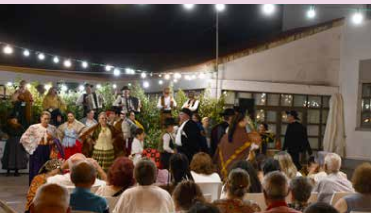
XXX Festival de Folclore de Nisa