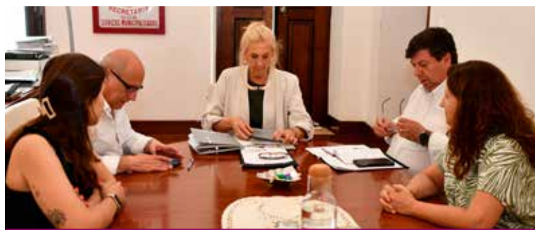
Assinatura de Contratos de Trabalho