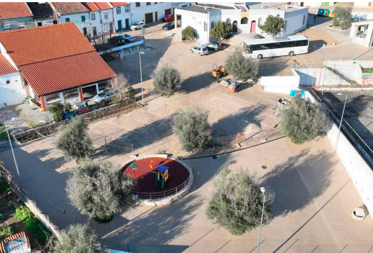
AMIEIRA DO TEJO - Requalificação da Tapada do Chão de Alter em Amieira do Tejo Valor Contratado: 315.044,75€