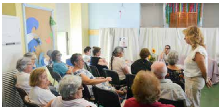
Chá com Letras em Nisa