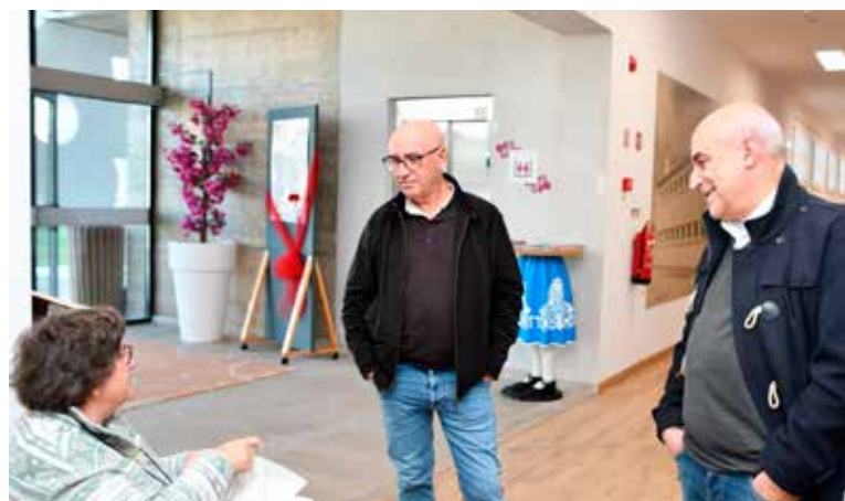
Roteiros de Natal Centro de Artes e Ofícios