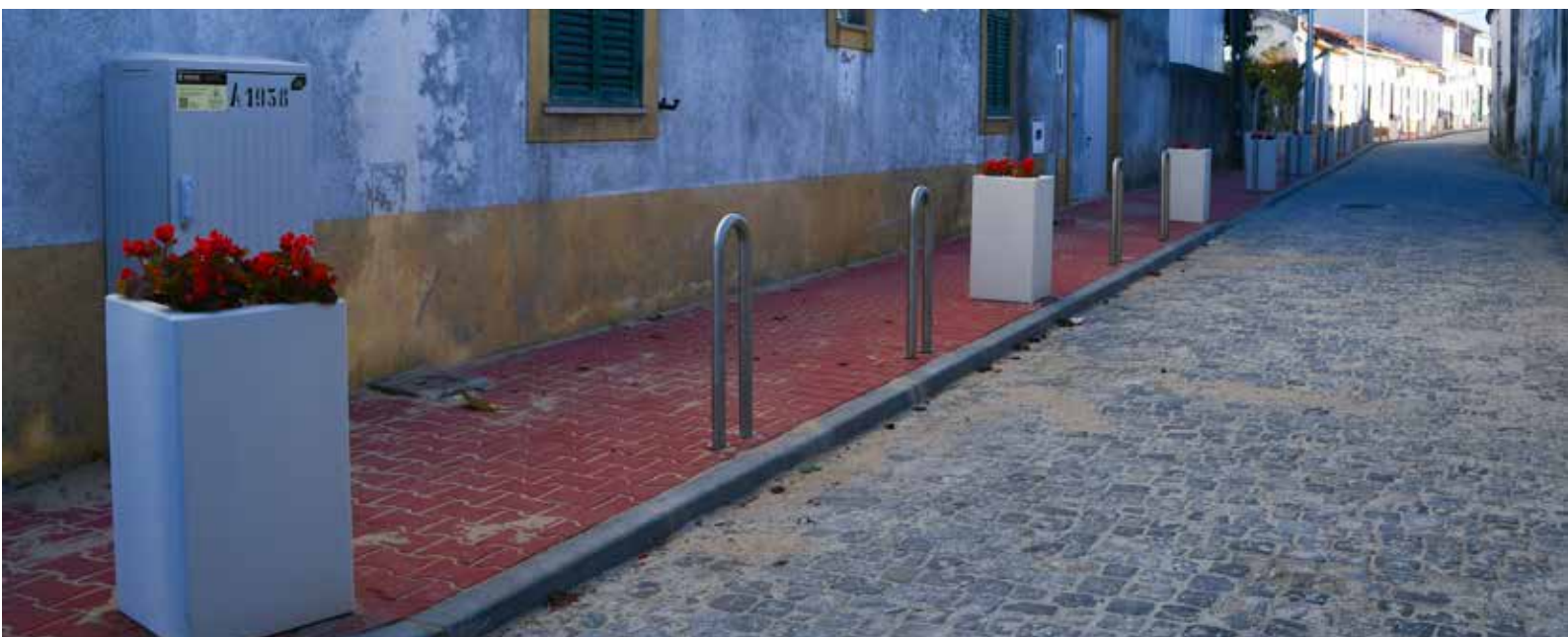
NISA – Beneficiação da Rua da Fábrica Valor contratado: 90.311,03€