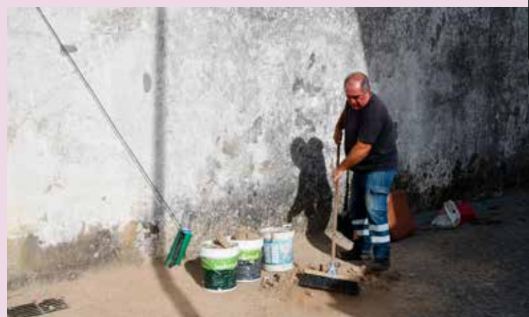
Reparação de Calçada