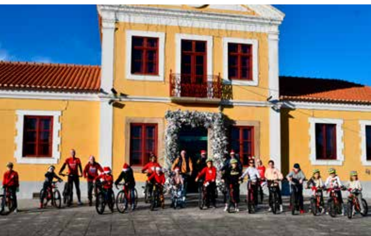
Passeio de Pais Natal em Bicicleta