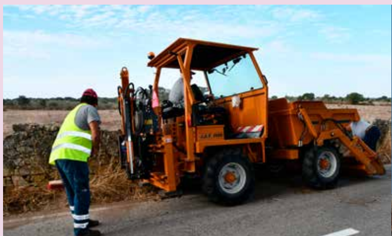
Limpeza de bermas em estradas do concelho