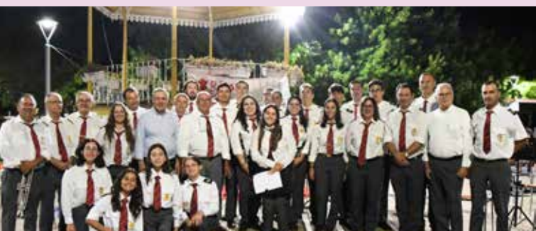
Rota dos Coretos em Nisa