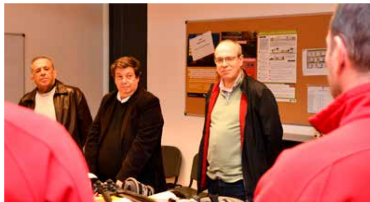
Entrega de equipamentos aos Bombeiros