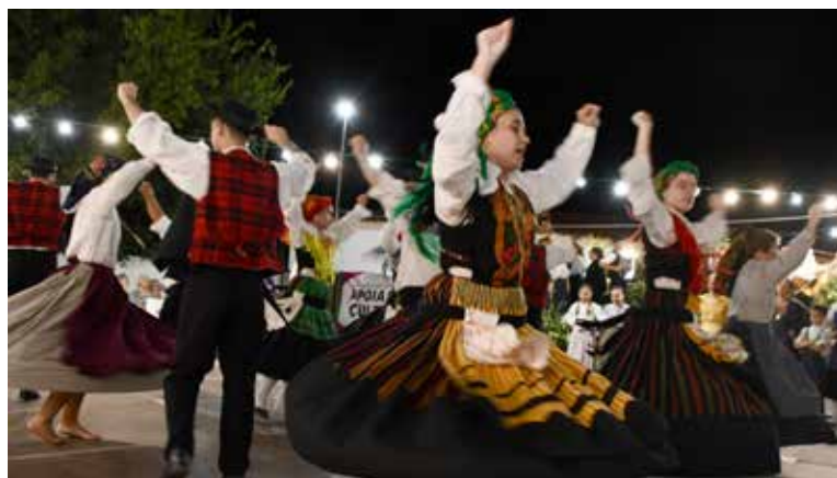
XXX Festival de Folclore de Nisa