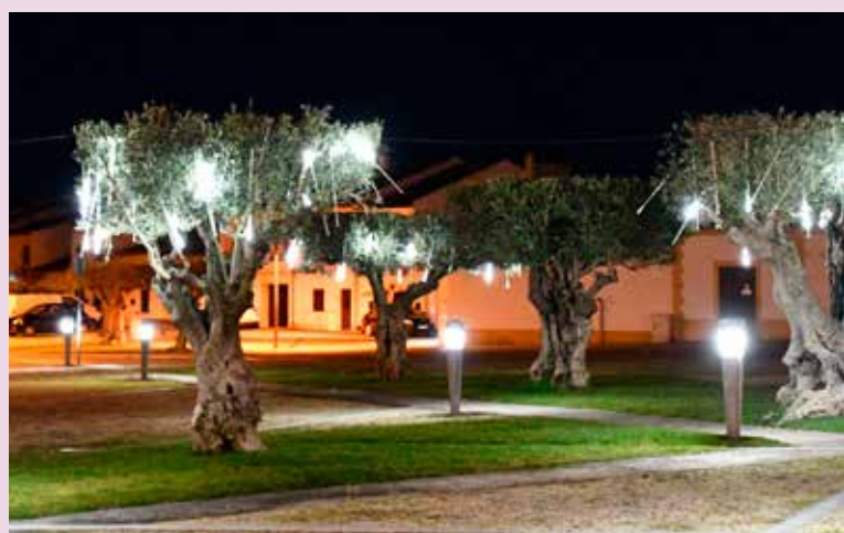
Iluminações de Natal Largo da Devesa em Nisa