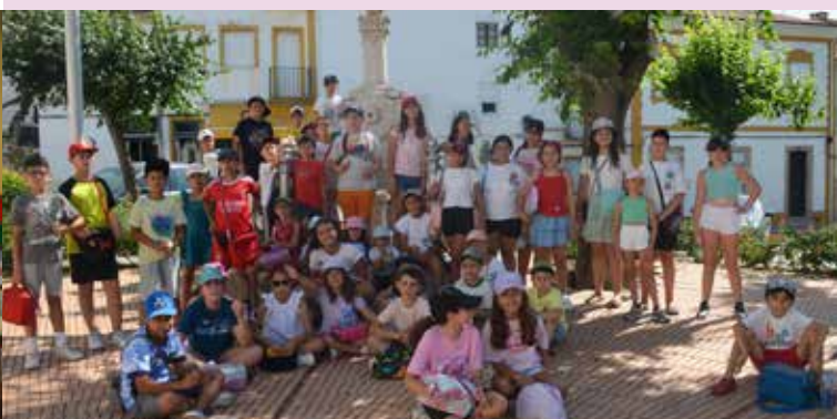
Atividades ao ar livre