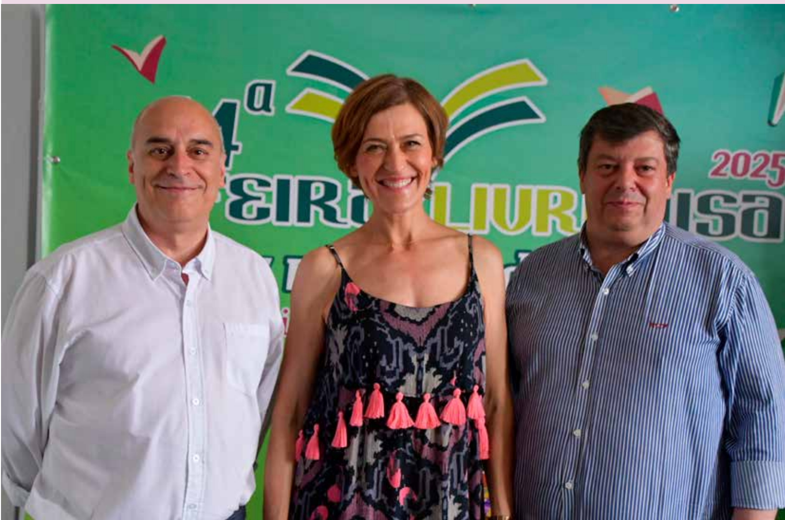
Encontro com a apresentadora Fátima Lopes