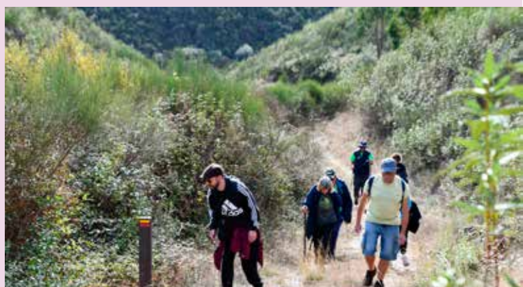
PR6 "Rota dos Açudes"