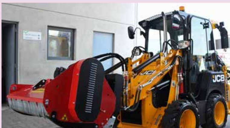
Novos equipamentos de apoio à Proteção Civil