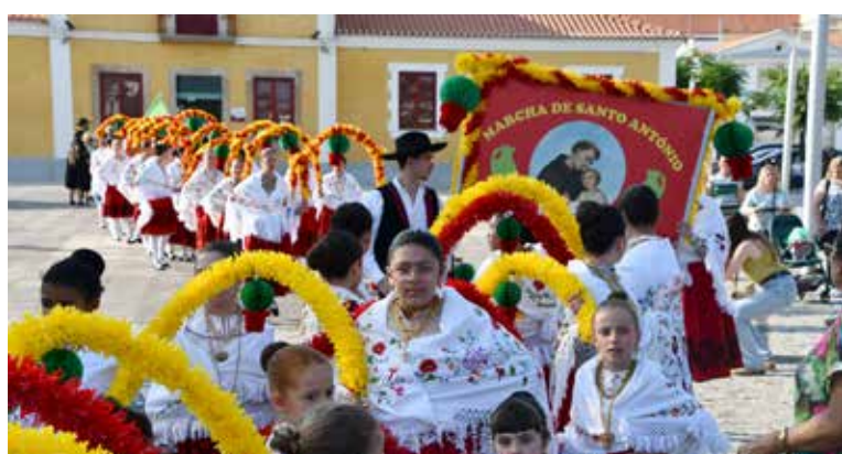
Marchas de Santo António