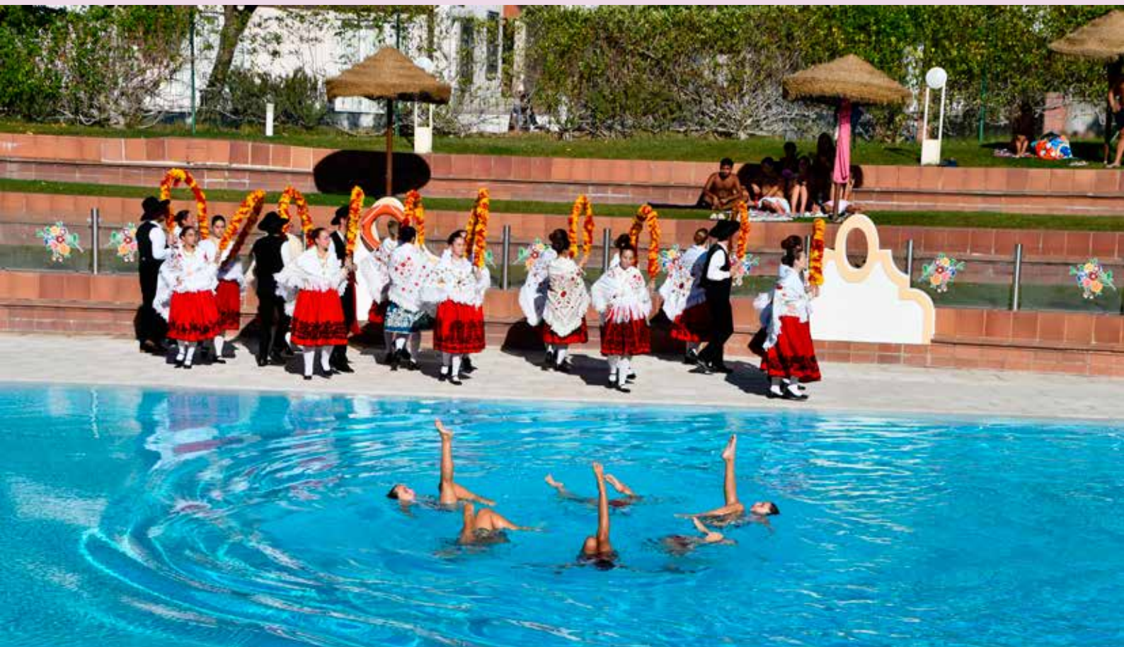
Espetáculo de natação sincronizada com as Marchas de Santo António