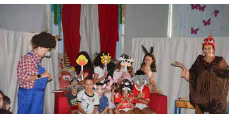
Sábados com Histórias