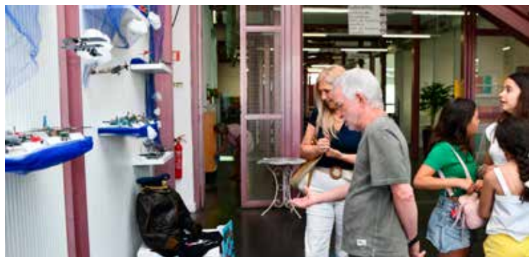
Exposição “Modelos de Aviões em Miniatura”