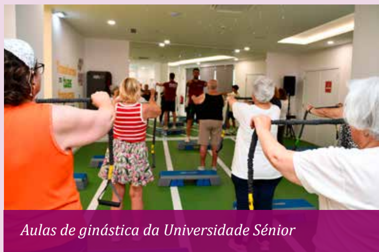
Aulas de ginástica da Universidade Sénior