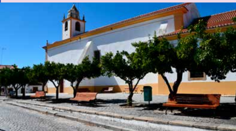
ALPALHÃO – Substituição de Bancos