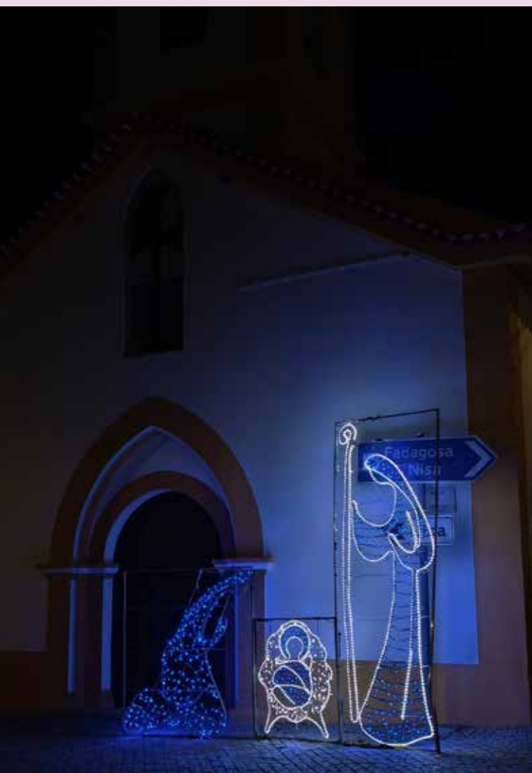
AREZ Iluminação junto à Igreja Matriz