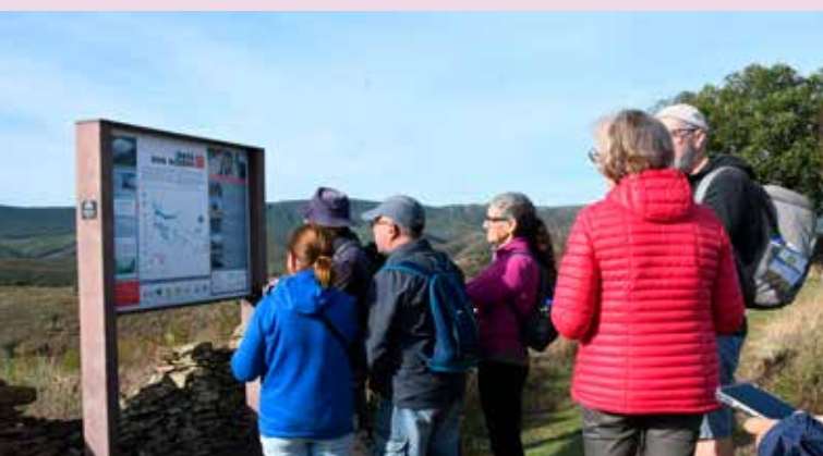
PR6 "Rota dos Açudes"