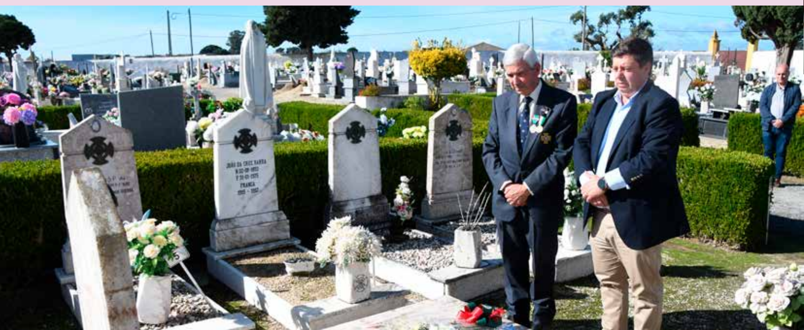
Romagem ao Talhão dos Combatentes no Dia de Finados