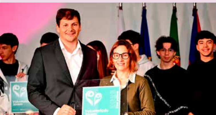
Prémio de Boas Práticas de Voluntariado