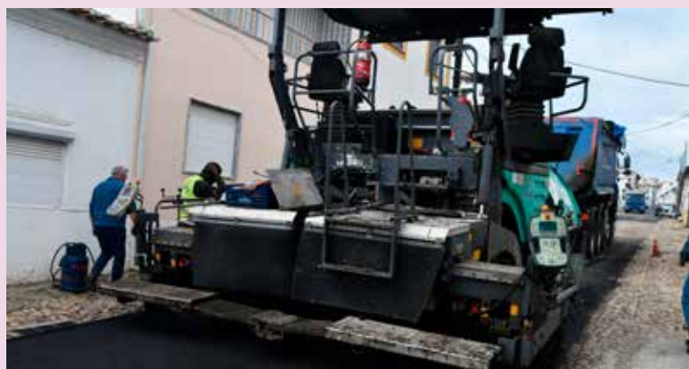
TOLOSA – Beneficiação da Rua de Abrantes