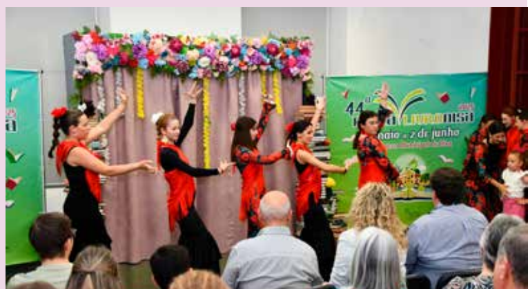
Grupo de Sevillanas Essência Rociera