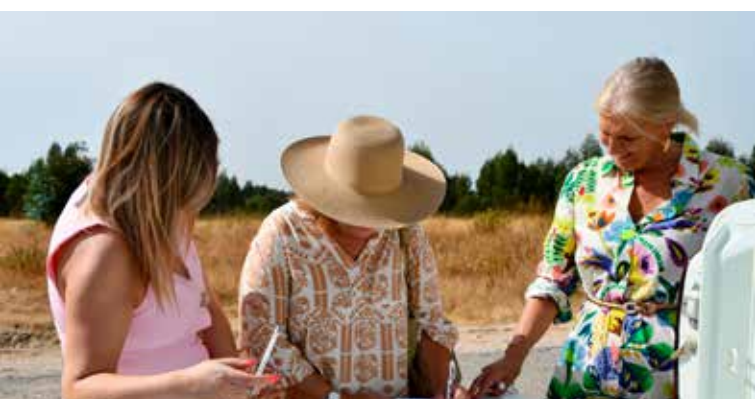
Posse de parcela de Terrenos