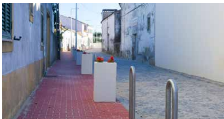
NISA – Beneficiação da Rua da Fábrica