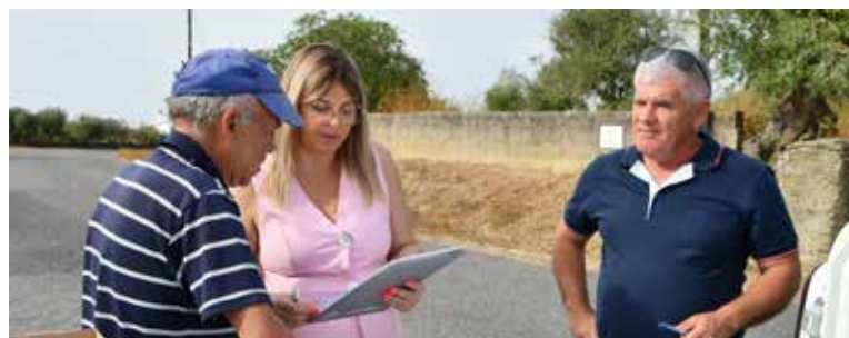
Posse de parcela de terrenos