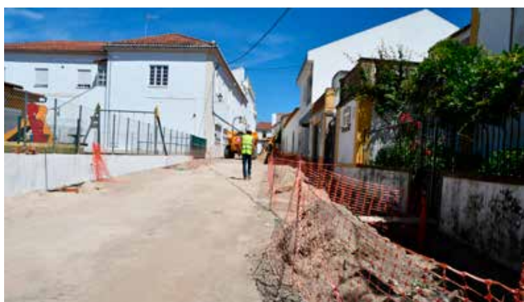
NISA – Beneficiação da Rua Capitão Vaz Monteiro