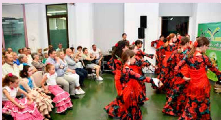
Grupo de Sevillanas Essência Rociera