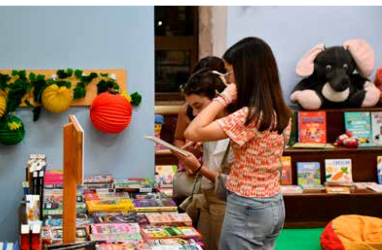
Certame de livros