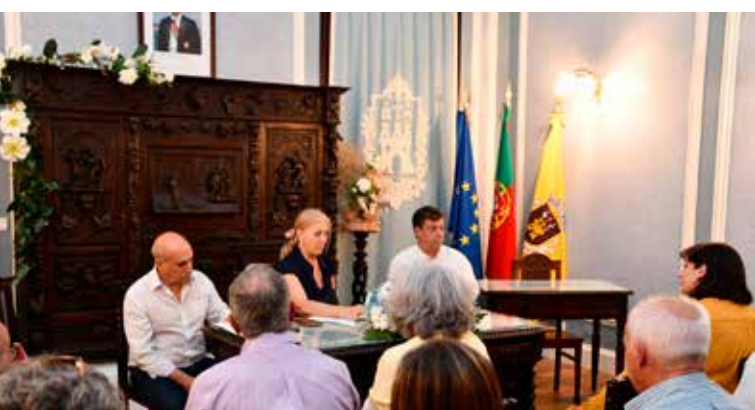
Entrega de subsídios às IPSS's