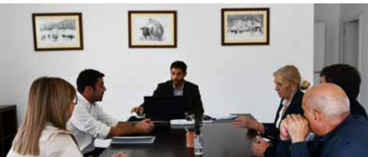
Escritura de parcela de terrenos

concretização desta infraestrutura estratégica, que reforçará a ligação transfronteiriça, impulsionará o desenvolvimento regional e aproximará ainda mais as populações de ambos os lados da fronteira.