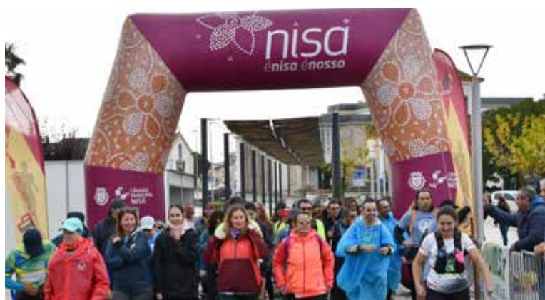
IX Trail Running Vila de Nisa