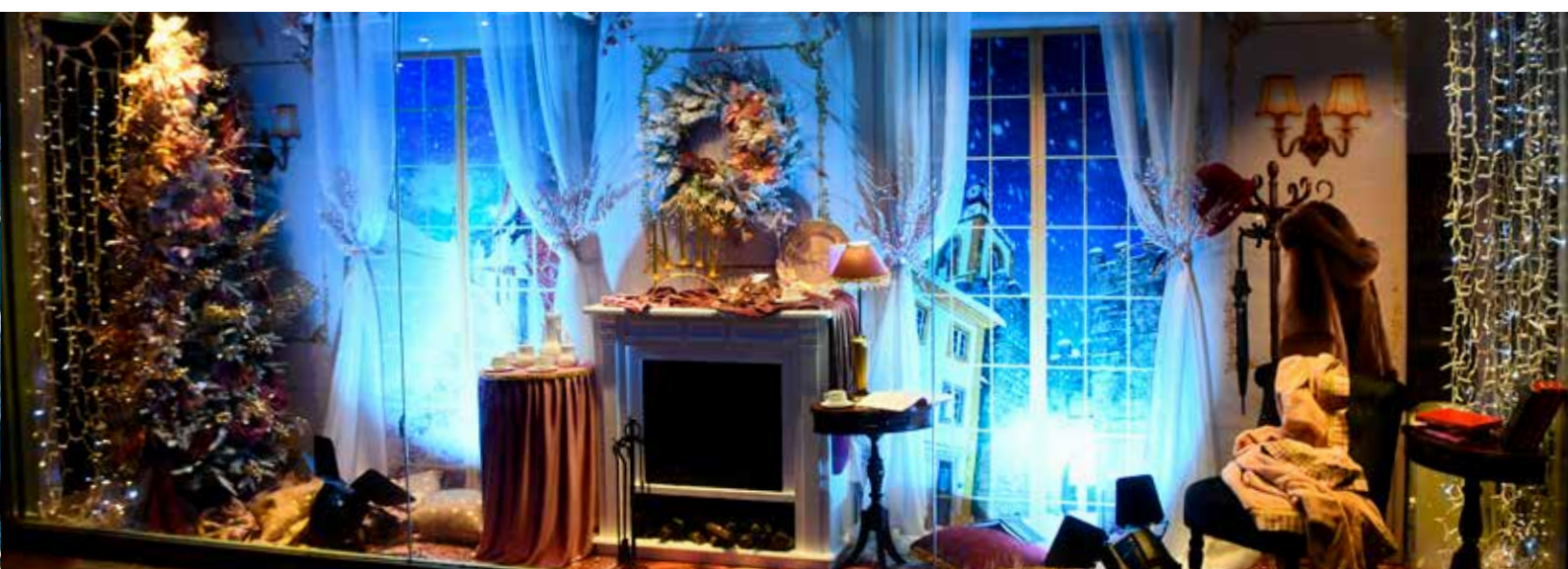
Montra de Natal 2025 no Posto de Turismo de Nisa