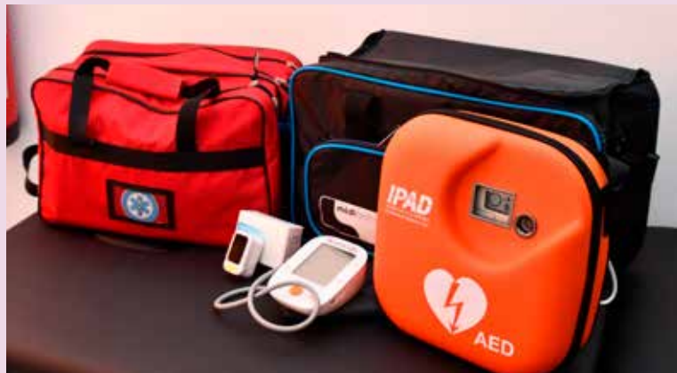
Reforço de equipamentos de socorro e emergência