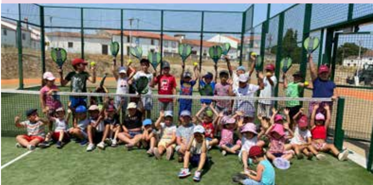
Jogos de Padel