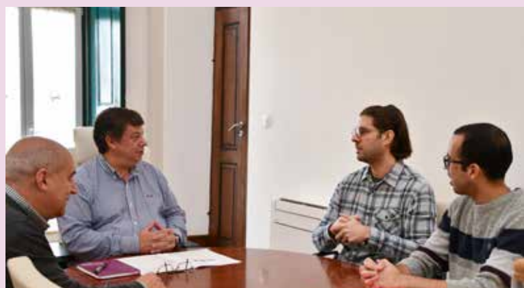
Representantes da Unidade de Saúde Pública