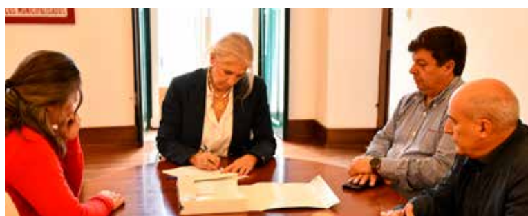
Entrega de projeto

Num gesto de valorização do associativismo e da identidade local, entregámos à Associação dos Amigos do Mártir Santo o projeto de arquitetura para a reabilitação da sua sede, elaborado gratuitamente pelos nossos serviços técnicos, uma ação repleta de proximidade e reconhecimento pelo trabalho que esta coletividade dedica a uma das festividades populares mais emblemáticas do nosso concelho.