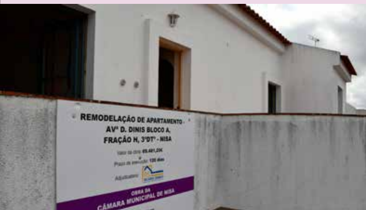
NISA – Renovação de apartamento na Av. D. Dinis (69.481,25€)