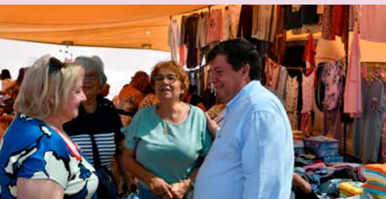
Feira das Cerejas 2025