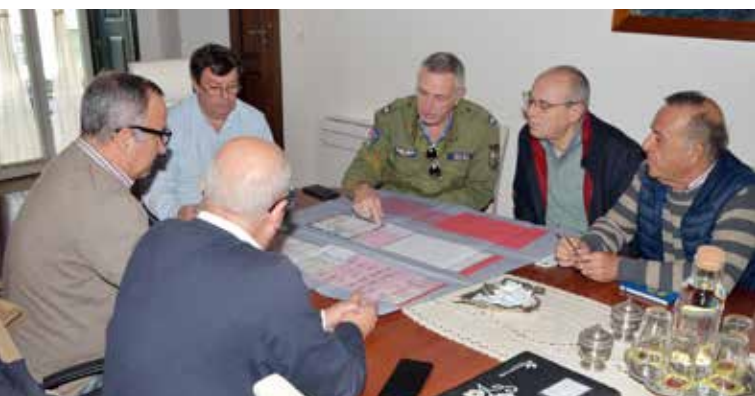
Reunião Técnica de apresentação do Projeto