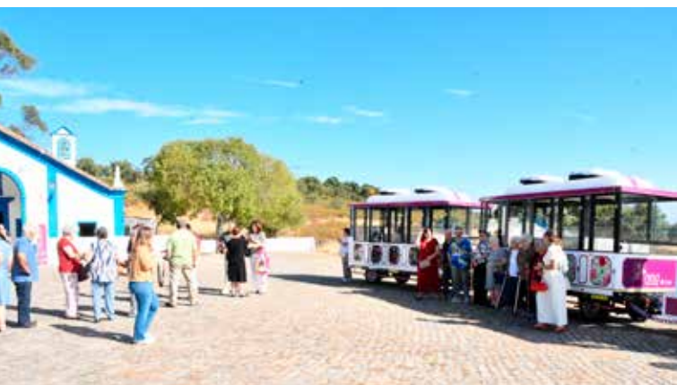
Comboio Turístico nas Freguesias Montalvão