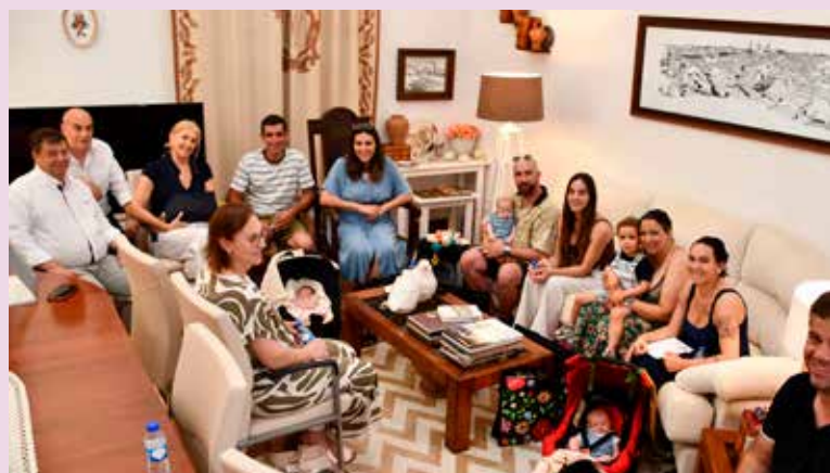
Entrega de cheques “Nascer em Nisa”