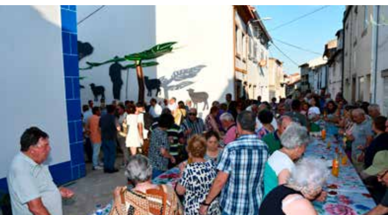
Inauguração da obra