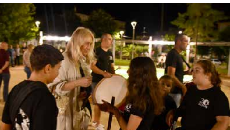
Bombos de Nisa na Praça da República