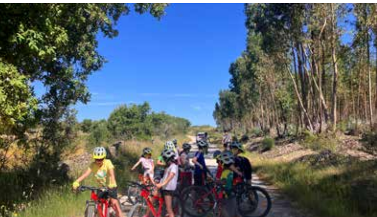
Passeios de Bicicleta