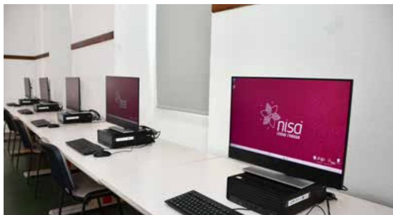
Novos computadores na Biblioteca Municipal