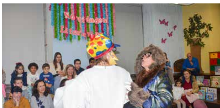
Sábados com Histórias