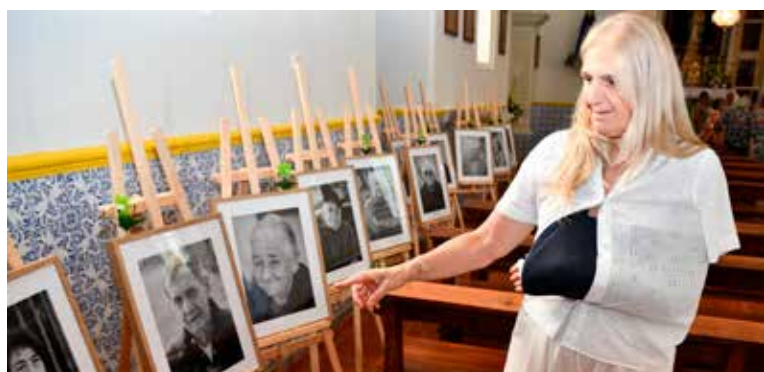
Exposição "Memórias de Permanência"