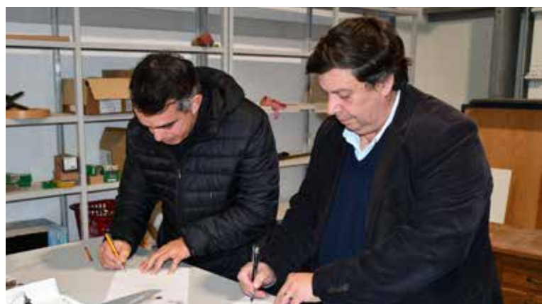
Assinatura de contrato na Incubadora de Novas Empresas (Área da Carpintaria)