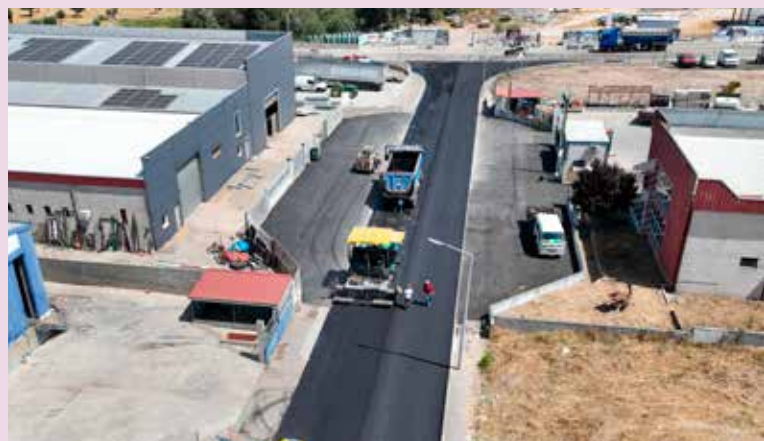
NISA – Beneficiação de arruamentos na ZAE