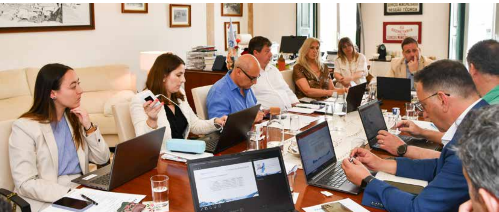
Reunião ordinária do Conselho de Administração das Águas dos Alto Alentejo