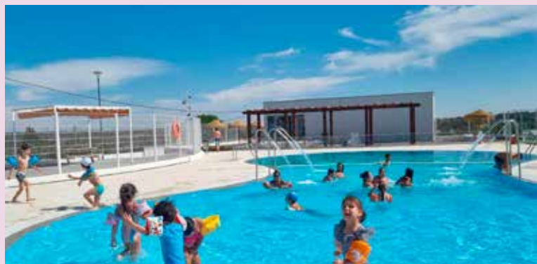
Atividades na Piscina de Tolosa