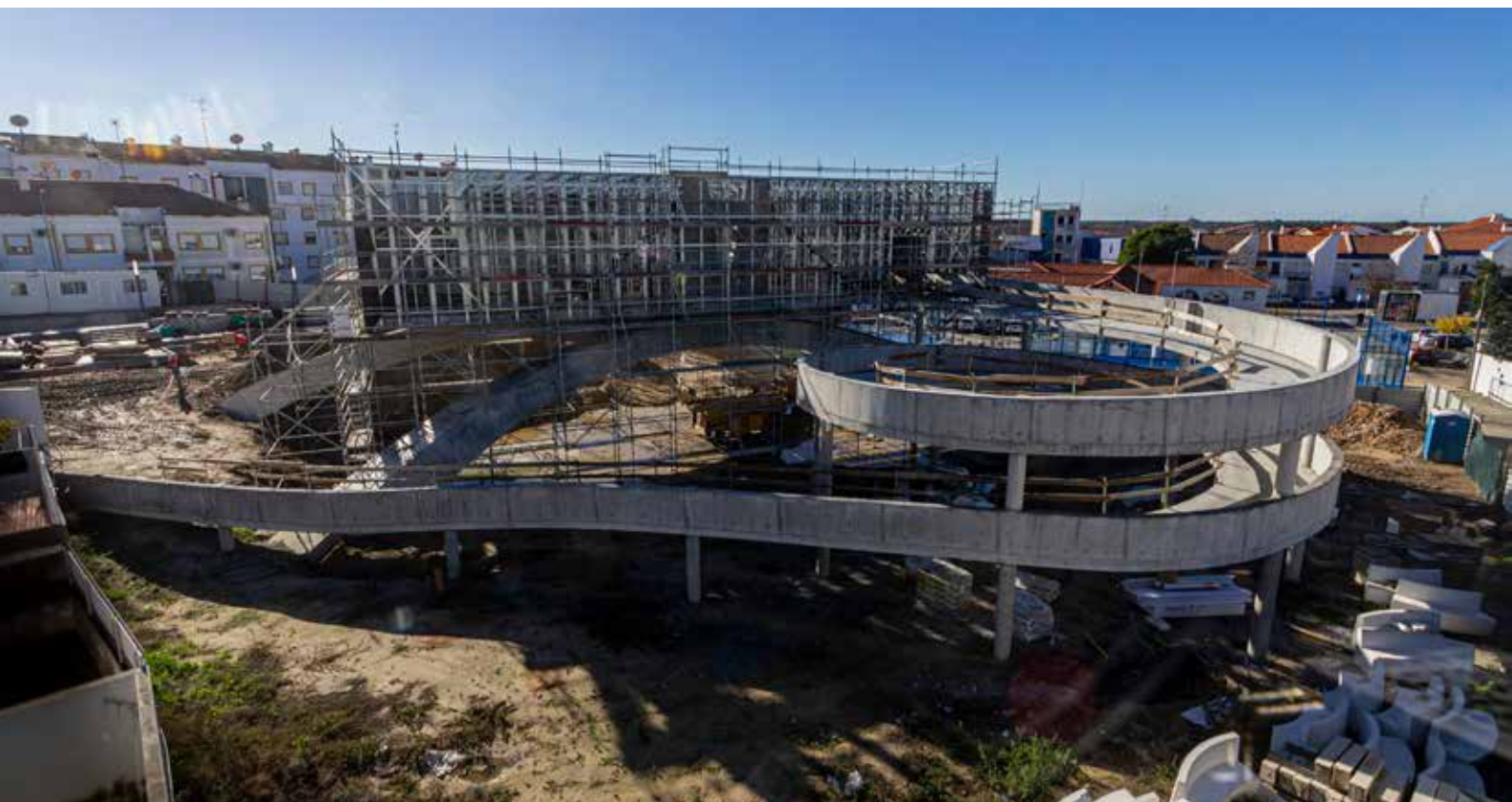
NISA - Nisa Tech - Espaço Multiusos de Inovação e competitividade / ÉNisa Parque Cultural Valor Contratado: 1.899.995,26 €