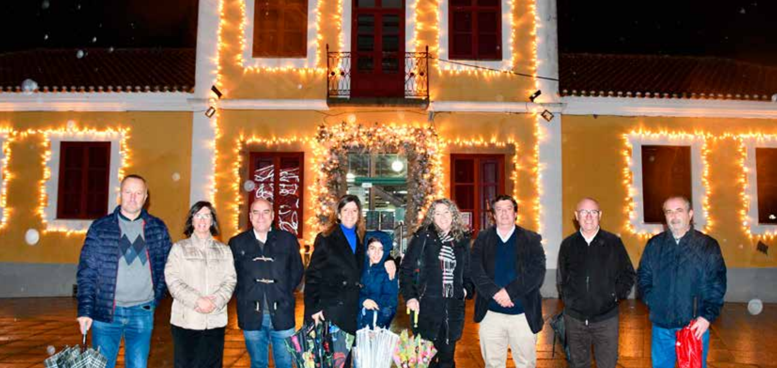
Iluminações de Natal - Biblioteca Municipal de Nisa