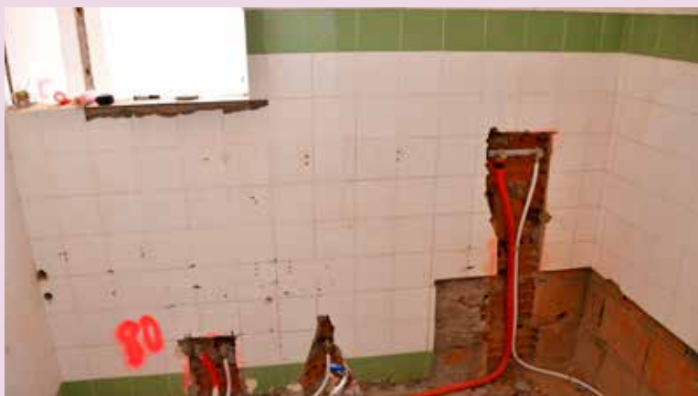
NISA – Renovação de apartamento na Av. D. Dinis (69.481,25€)