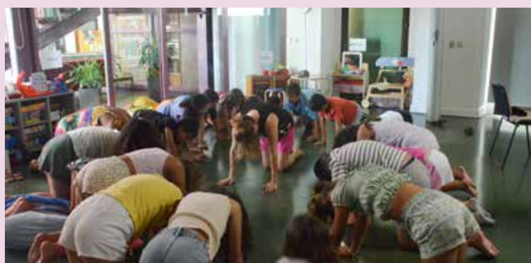
Sessões de Yoga