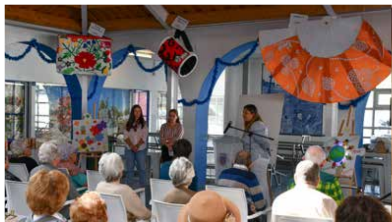
Atividades no Mercado Municipal