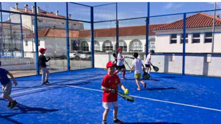
Jogos de Padel