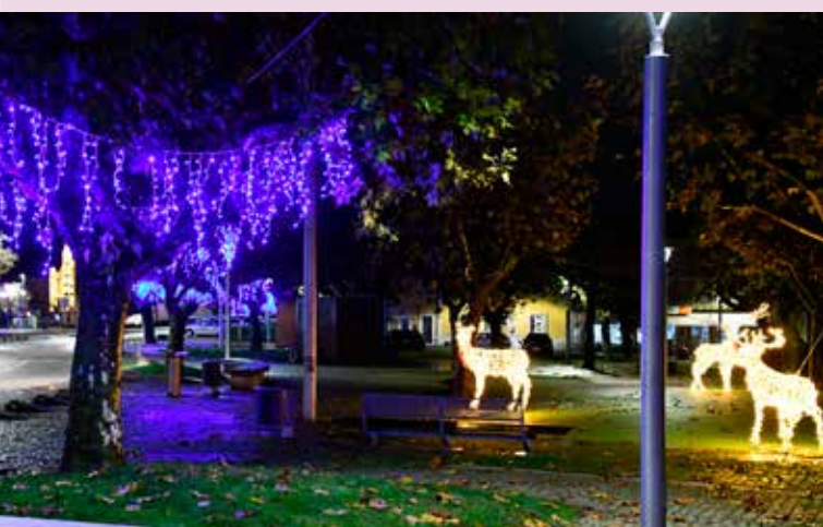
Iluminações de Natal Junto ao Posto de Turismo