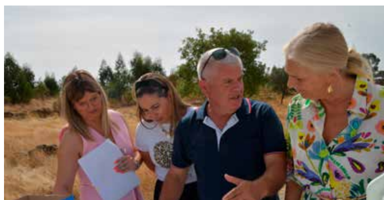
Posse de parcela de terrenos