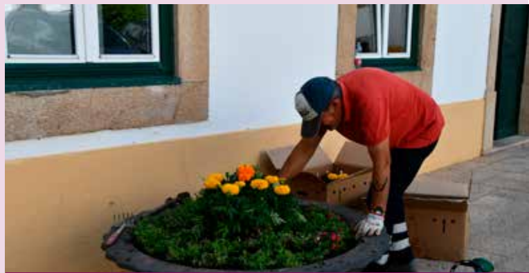
Reposição de flores na Praça do Município