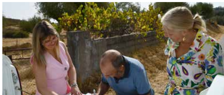
Posse de parcela de terrenos