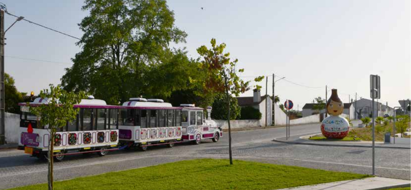
Comboio Turístico nas Freguesias - Alpalhão