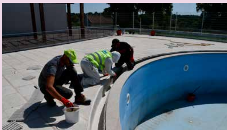
TOLOSA – Manutenção da Piscina Municipal de Tolosa