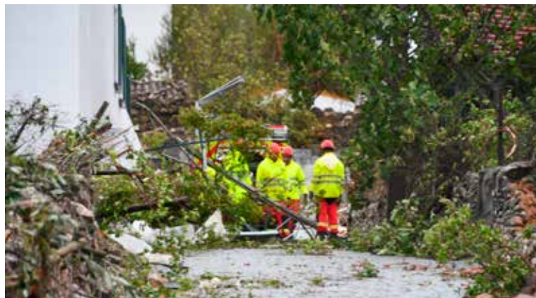
Estragos do Tornado na Falagueira