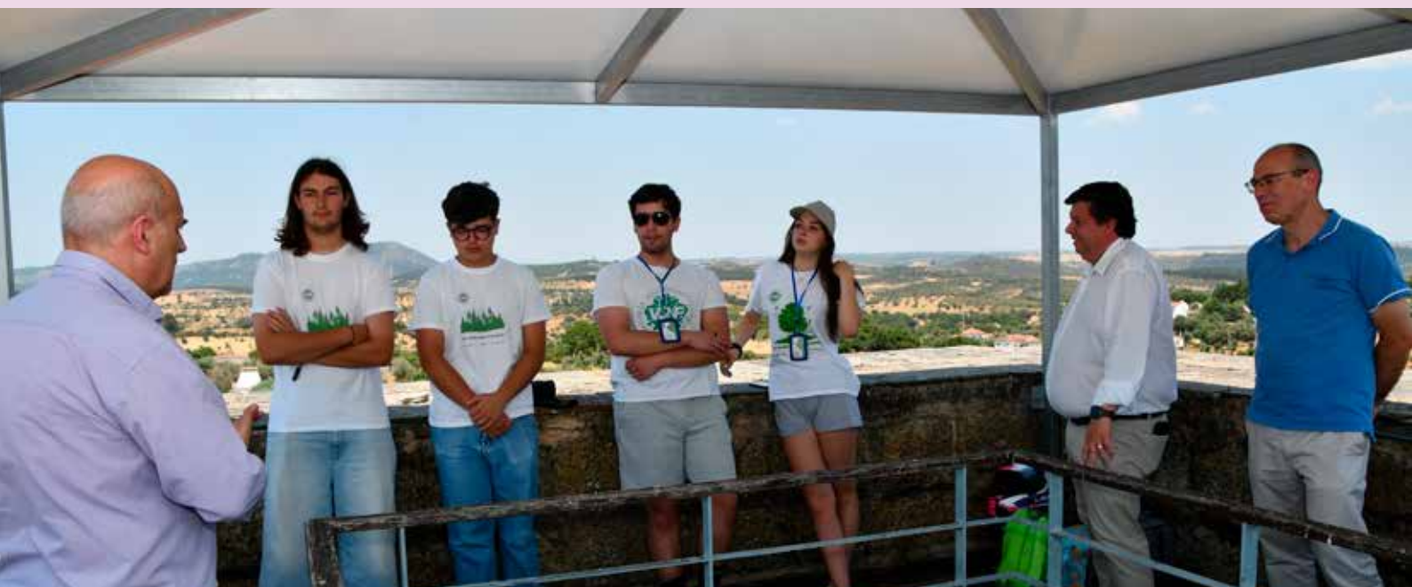
1º Turno do Voluntariado Jovem para a Natureza e Florestas