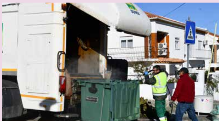
NISA – Lavagem e desinfecção de contentores de lixo