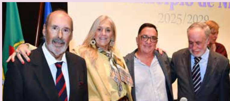
Membros da Assembleia Municipal de Nisa