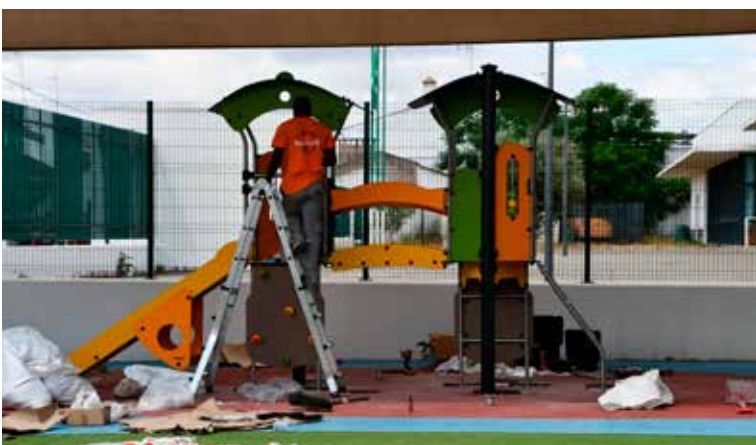
NISA – Renovação do Parque Infantil no Centro Escolar