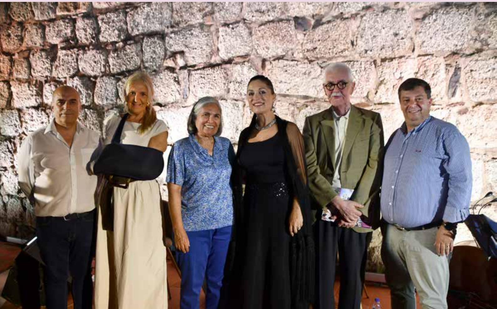
Recital de Fado na Casa das Memórias