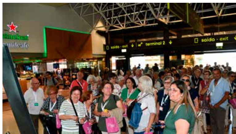
Saída do Aeroporto de Lisboa