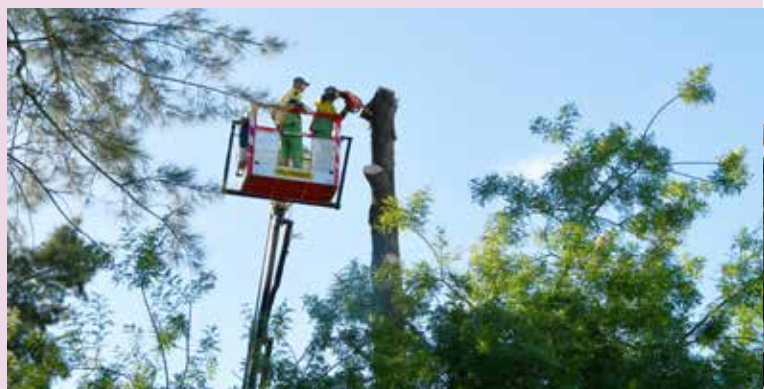
Corte de árvores no Jardim Municipal