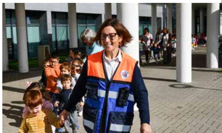
Exercício "A Terra Treme"