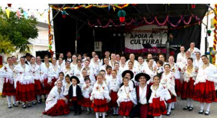
Marchas de Santo António