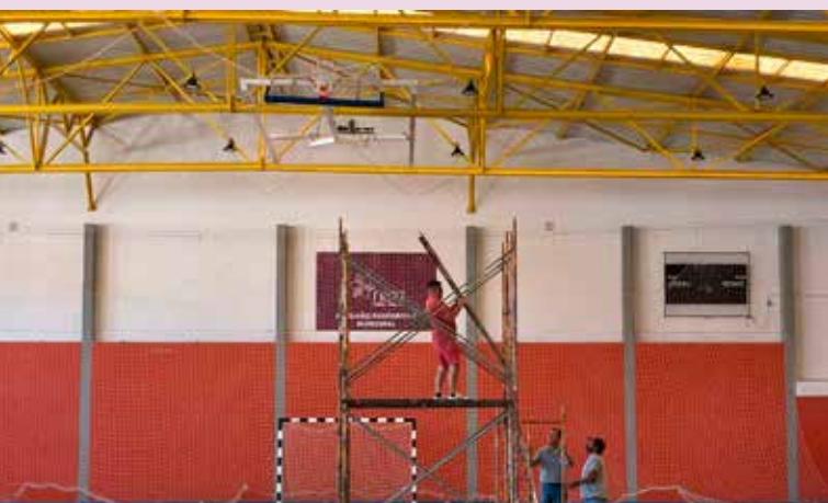
Substituição de luminárias no Pavilhão Municipal de Nisa