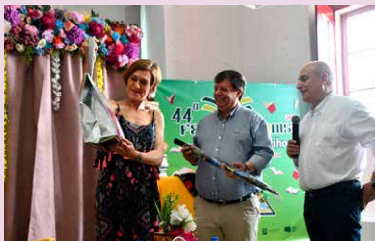
Entrega de ofertas