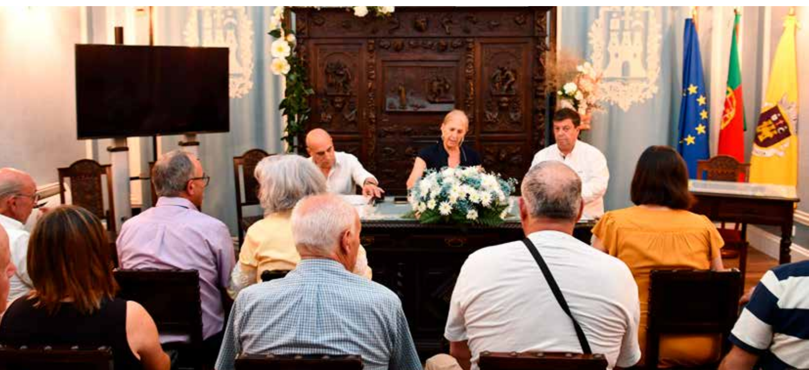
Entrega de subsídios às IPSS's

Particular de Solidariedade Social (IPSS) do Concelho, com o objetivo de mitigar constrangimentos recentes, como os causados pelo apagão elétrico, e responder a desafios que possam comprometer a qualidade dos serviços sociais prestados.