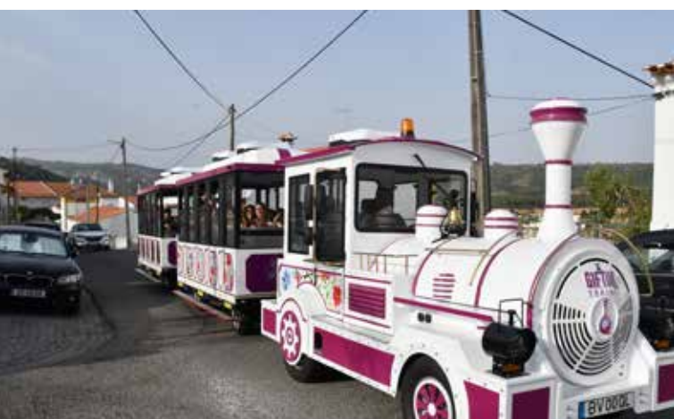
Comboio Turístico nas Freguesias Santana