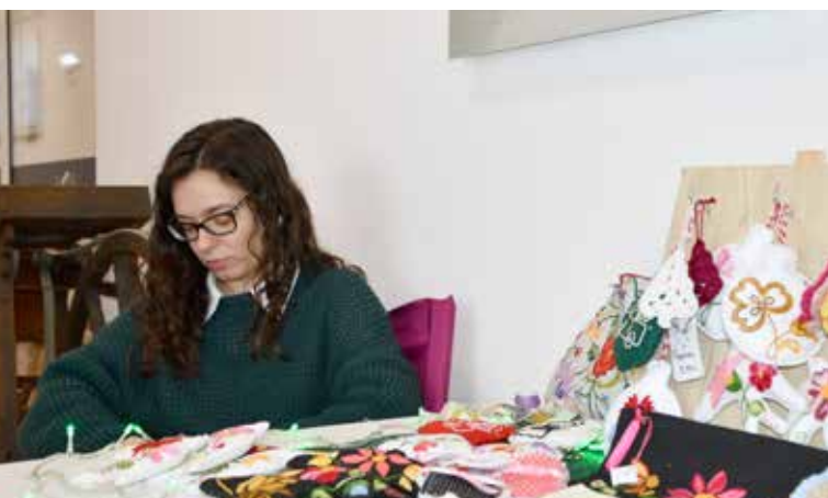
Roteiros de Natal Centro de Artes e Ofícios