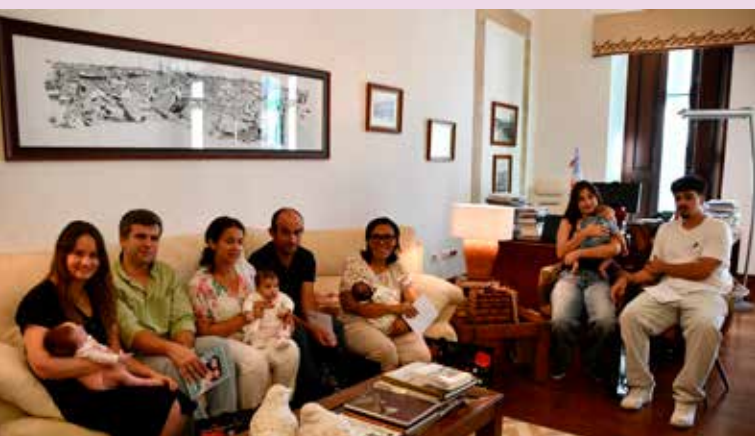
Entrega de cheques “Nascer em Nisa”