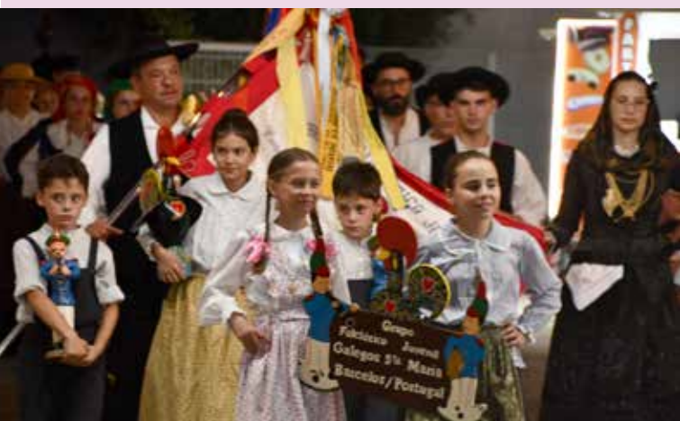
XXX Festival de Folclore de Nisa