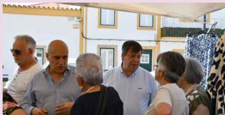
Feira das Cerejas 2025