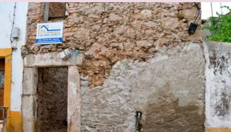
NISA – Conservação de casas no Centro Histórico (214.980,00€)