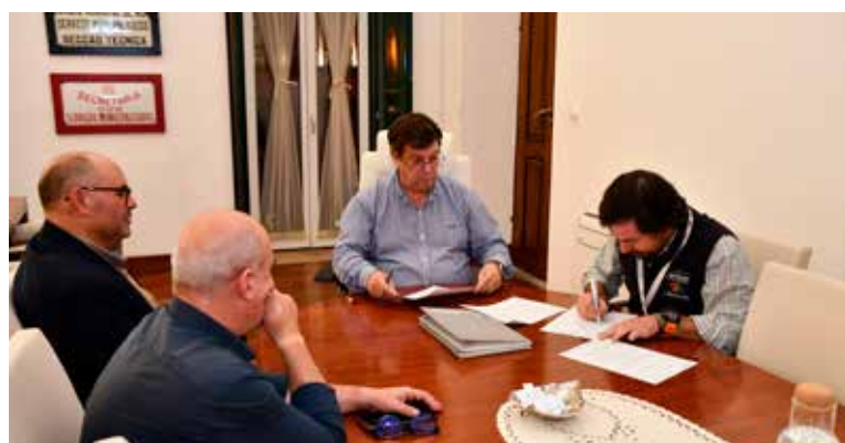
Assinatura de renovação de protocolo