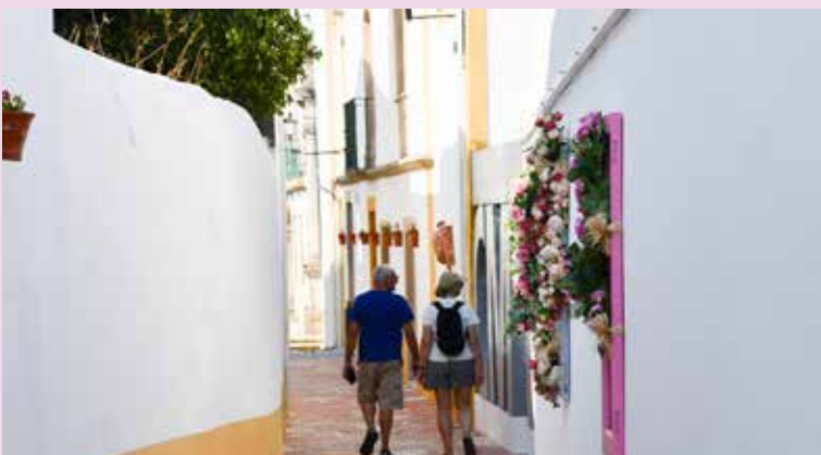
Janelas florais na Rua de Santa Maria