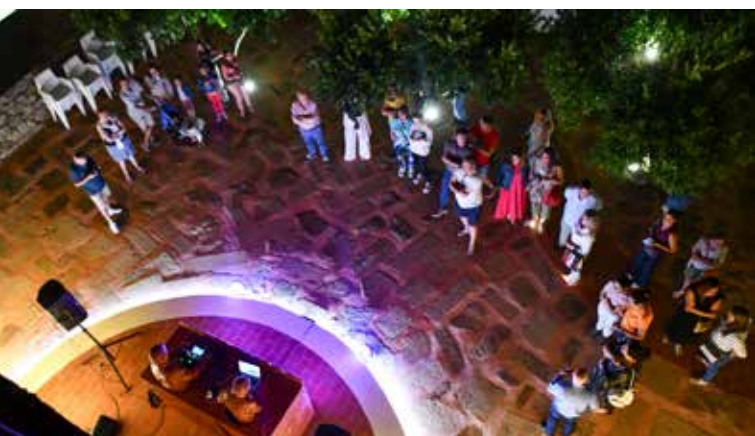
Dj's na Casa das Memórias