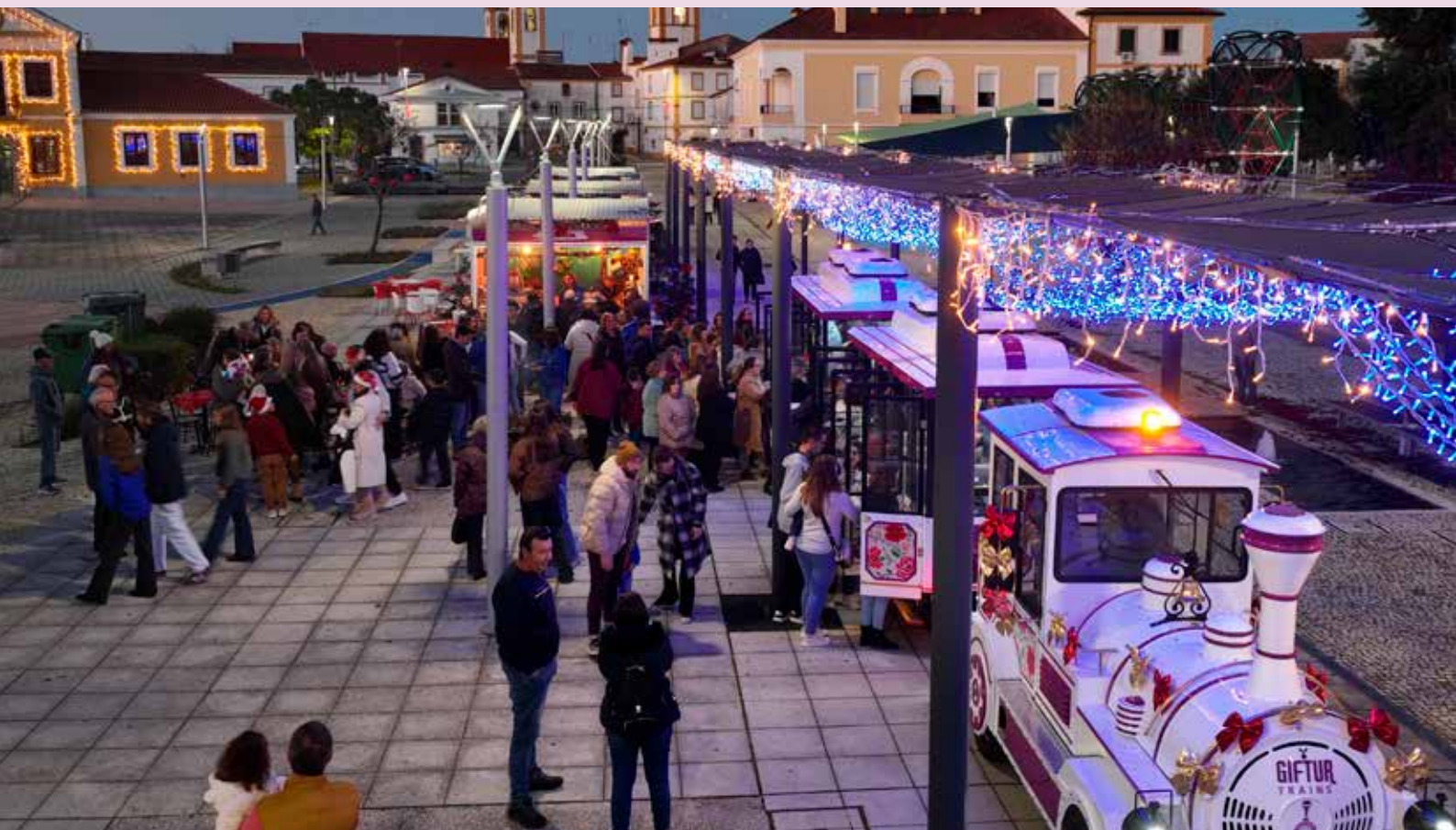
Mercadinho de Natal e Comboio de Natal