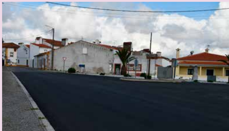
ALPALHÃO – Beneficiação do Ramal de Portalegre