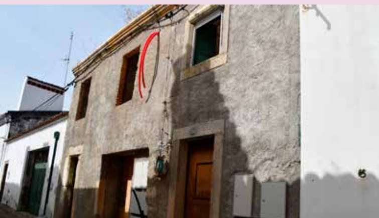
NISA – Conservação de casas no Centro Histórico (214.980,00€)