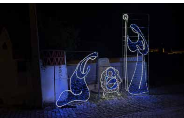
SALAVESSA Iluminação junto à antiga Escola Primária