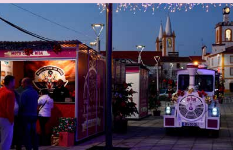
Mercadinho de Natal e Comboio de Natal