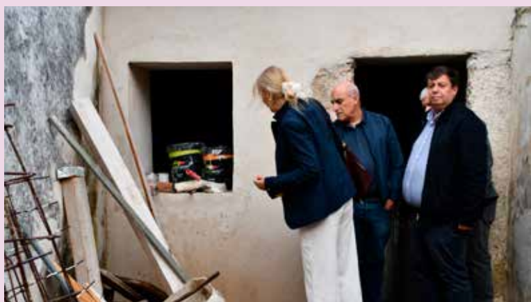
NISA – Conservação de casas no Centro Histórico (214.980,00€)