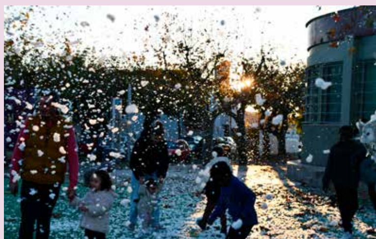
Canhões de Neve