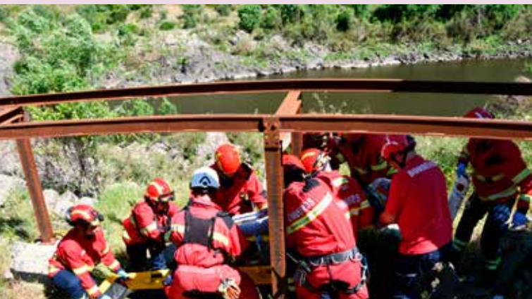
Exercício com os Bombeiros Voluntários de Nisa