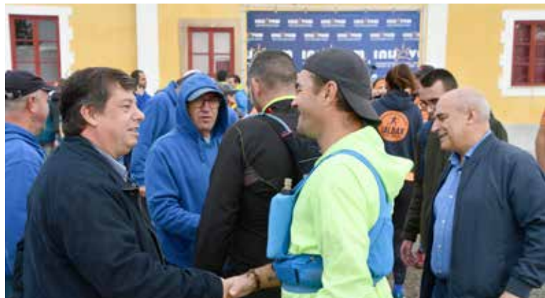
IX Trail Running Vila de Nisa

Celebrámos, juntamente com atletas, voluntários e organizadores, uma edição marcada pela energia, pela superação e pela beleza das nossas paisagens, mostrando mais uma vez que Nisa é palco de grandes desafios e grandes momentos.