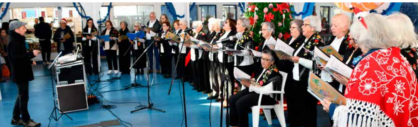
Canções de Natal - Universidade Sénior no Mercado Municipal de Nisa