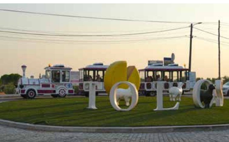
Comboio Turístico nas Freguesias Tolosa