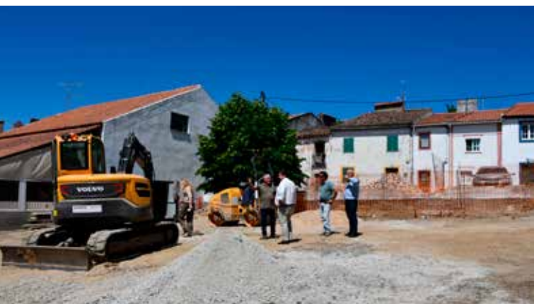
AMIEIRA DO TEJO - Requalificação da Tapada do Chão de Alter