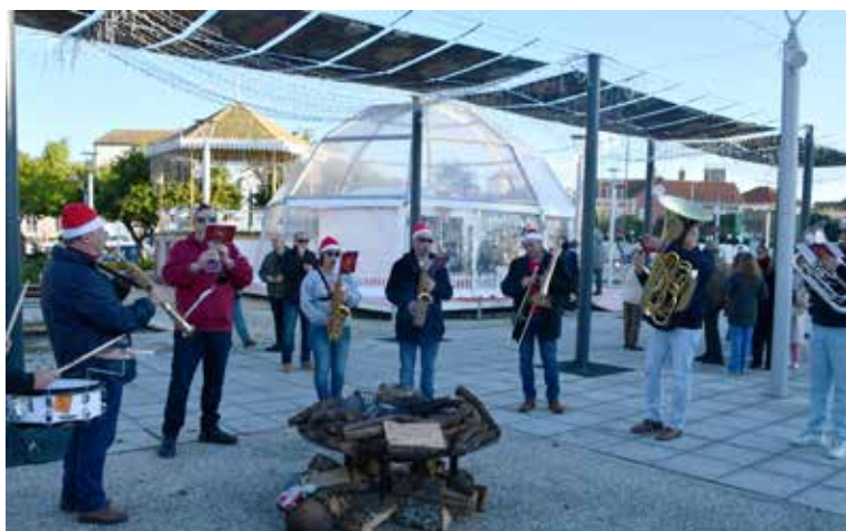
Animação de Rua Sociedade Musical Nisense