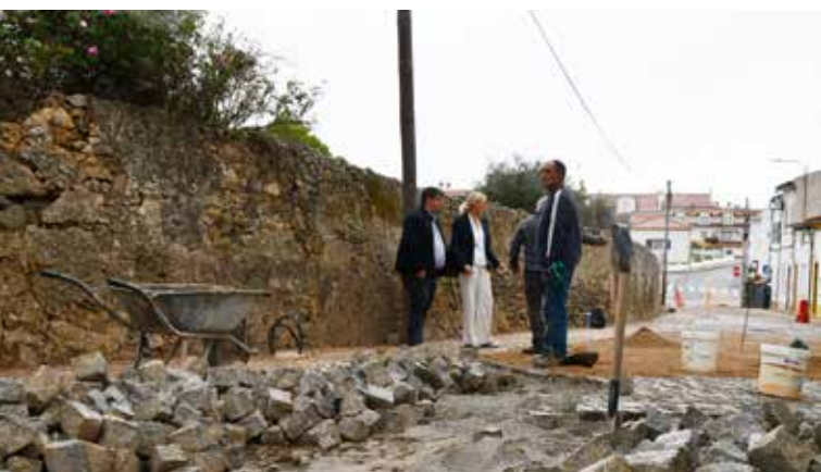
NISA – Beneficiação da Rua João de Deus