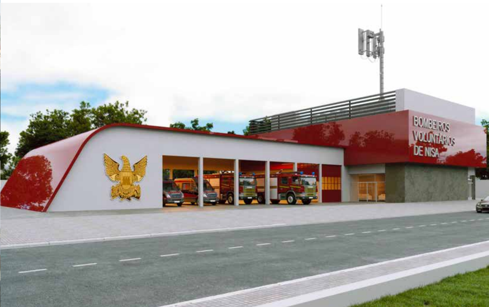
Projeto do novo Quartel dos Bombeiros Voluntários de Nisa a construir na ZAE