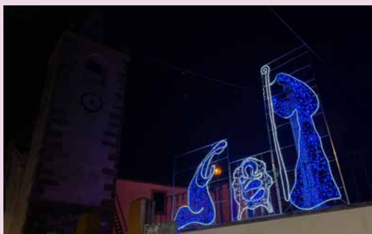
MONTALVÃO Iluminação junto à Igreja Matriz