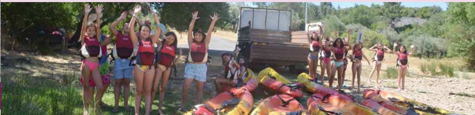
Canoagem no Cais do Pego das Portas

letiva, contribuindo para a ocupação saudável dos tempos livres, o desenvolvimento de competências e o bem-estar dos participantes, ao mesmo tempo que apoia os encarregados de educação na conciliação da vida familiar e profissional.