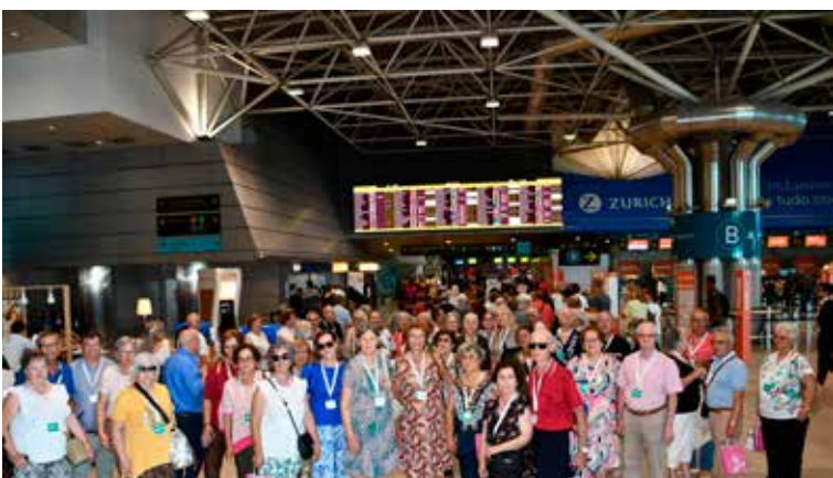
Saída do Aeroporto de Lisboa