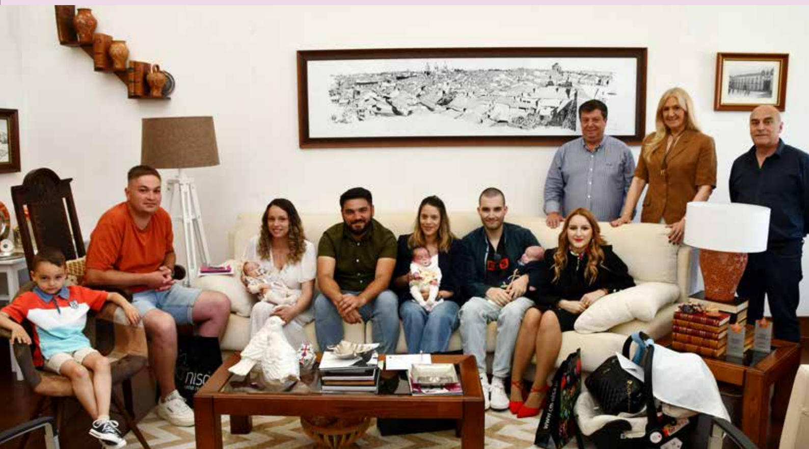
Entrega de cheques “Nascer em Nisa”