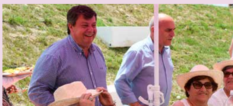
Oferta de brindes