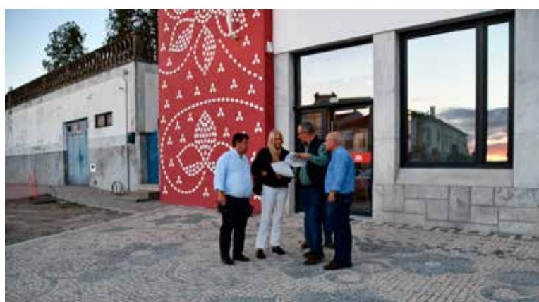
Calçada identitária em frente ao Ginásio