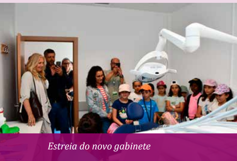
Estreia do novo gabinete

Esta iniciativa representa um avanço nos cuidados de saúde no interior, alinhando-se com as políticas de proximidade do SNS e do Município.