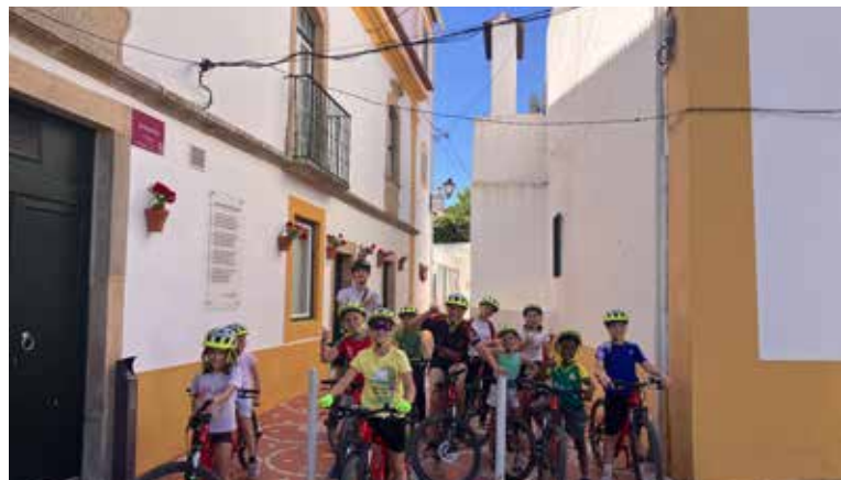
Passeios de Bicicleta