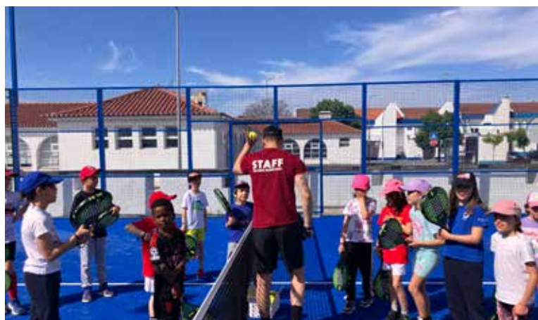
Jogos de Padel