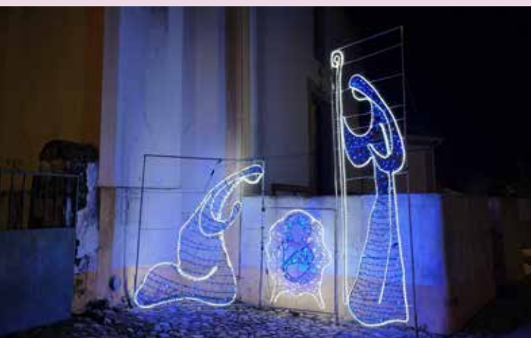
MONTE CLARO Iluminação junto à Igreja Matriz