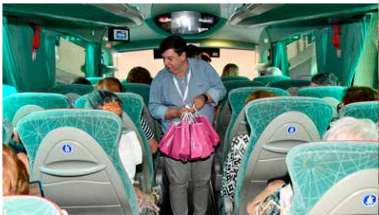
Regresso a Nisa