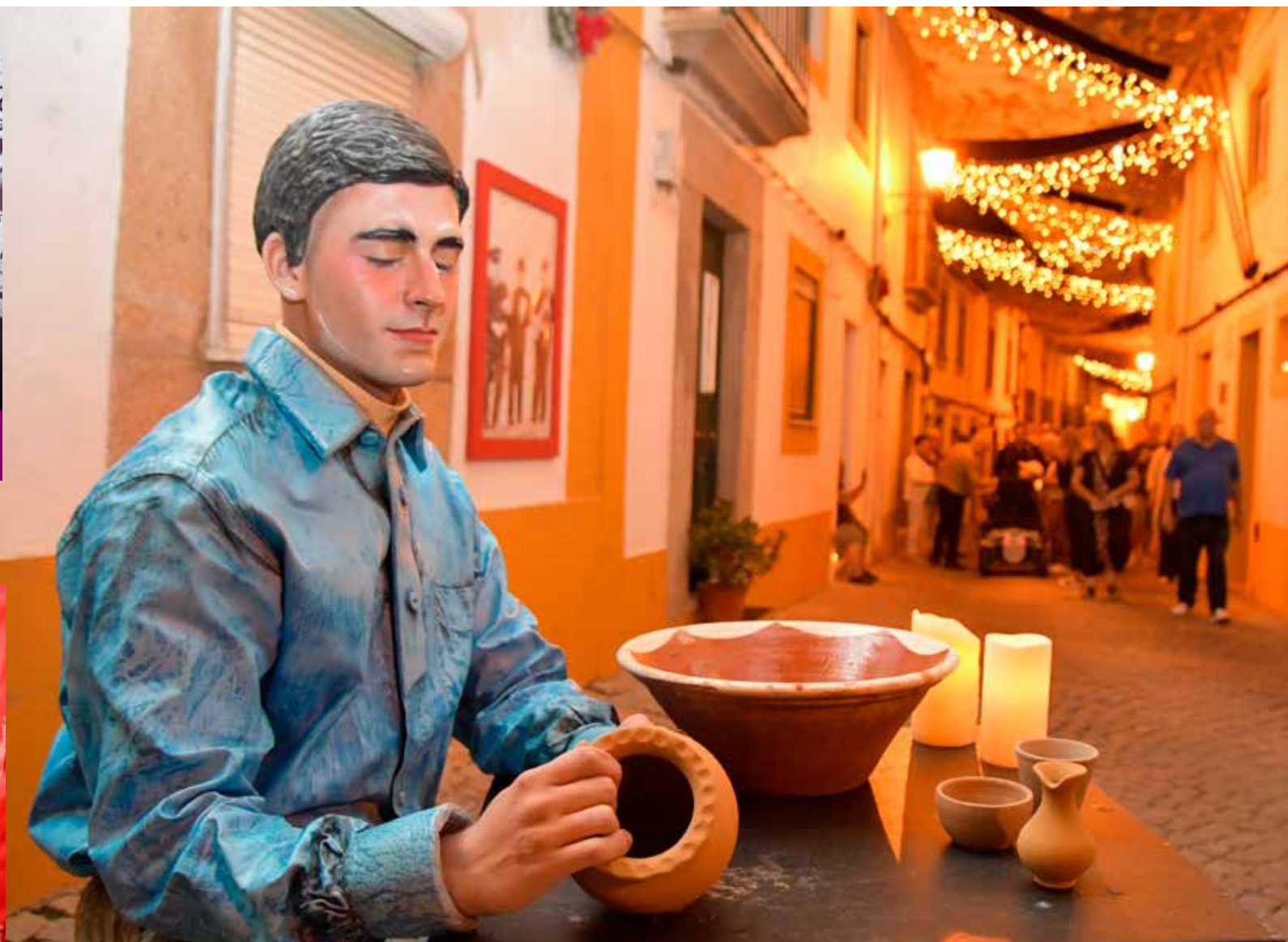
Estátua de pintura do barro

Durante duas incríveis noites, Nisa tornou-se num grande palco cultural ao ar livre, valorizando uma das mais importantes expressões do património local — a olaria pedrada, e reforçando a aposta no entretenimento artístico e na revitalização urbana e cultural da vila.