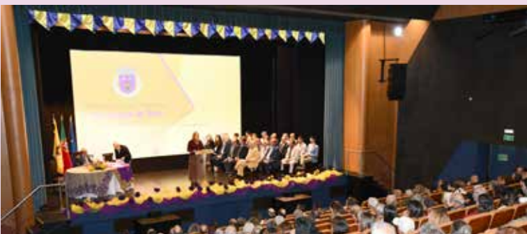
Cerimónia de Instalação dos novos Órgãos Autárquicos