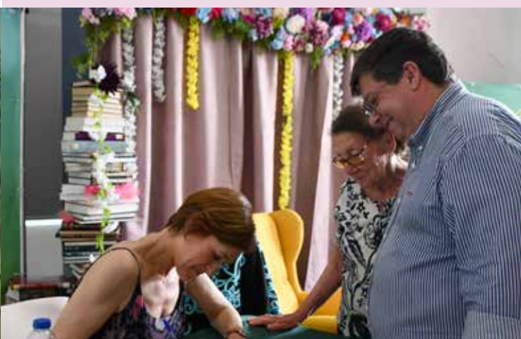
Sessão de Autógrafos