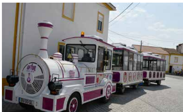
Comboio Turístico nas Freguesias Arez