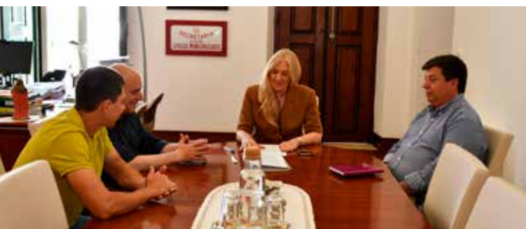
Assinatura de Contrato de Trabalho

A par disto, apostamos na formação, nomeadamente a formação em Suporte Básico de Vida (SBV) e utilização de Desfibriladores Automáticos Externos (DAE), reforçando a capacidade de resposta em situações de emergência e preparando preparação dos serviços municipais para proteger a nossa comunidade.