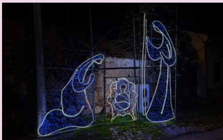
FALAGUEIRA Iluminação na Rua da Estrela