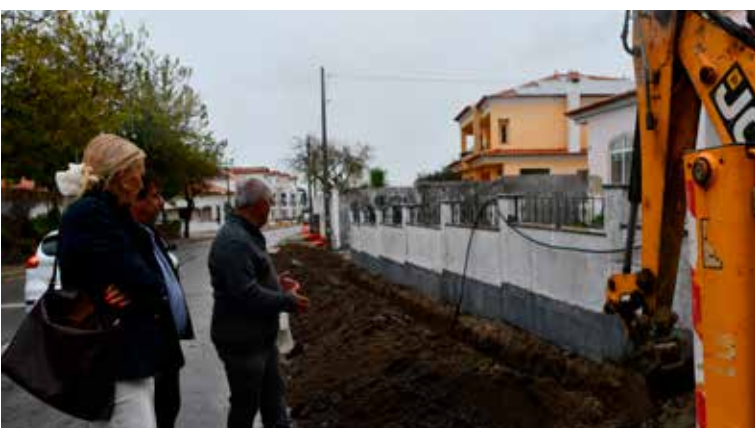
NISA – Beneficiação da Estrada das Amoreiras