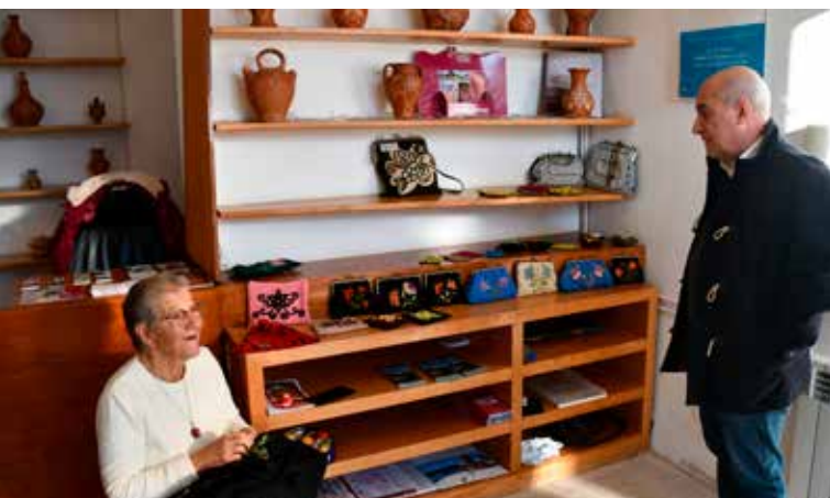
Roteiros de Natal Museu do Barro e do Bordado