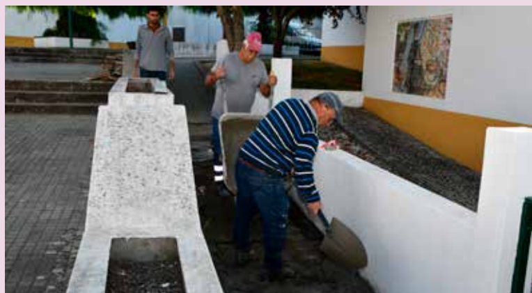
NISA – Rampa de Acessibilidade