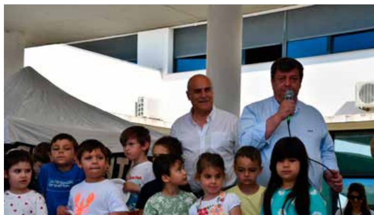
Atividades do programa EcoEscolas

A iniciativa foi um verdadeiro tributo ao património cultural de Nisa, aliando sustentabilidade, arte e tradição.