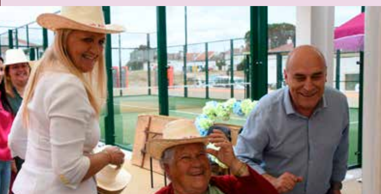
Oferta de brindes