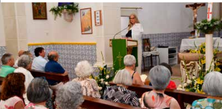
Inauguração da obra