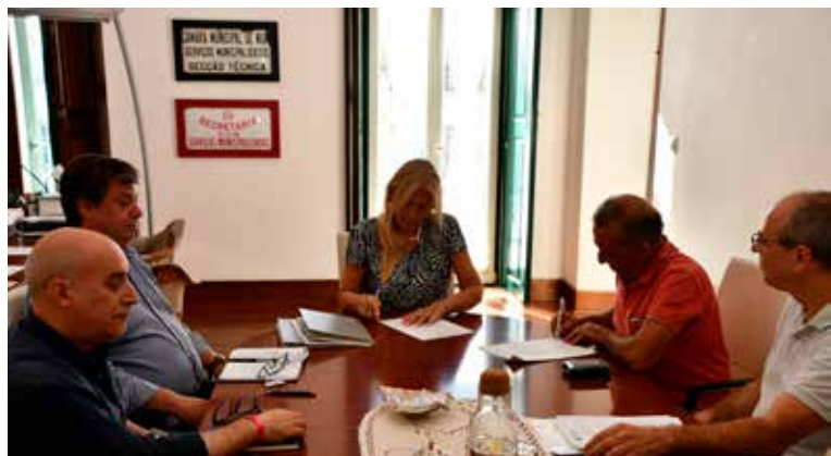
Assinatura de Protocolo de Cooperação

Paralelamente, investimos no reforço de equipamentos para a gestão das faixas de combustível e limpeza de mato, com financiamento do Programa Alentejo 2030, acolhemos a Máquina de Rasto da CIMAA para apoio ao combate aos incêndios e continuámos a melhorar os meios de socorro e emergência nos espaços municipais.