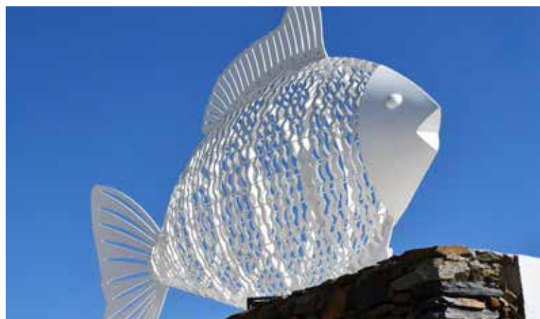
SANTANA - Instalação de escultura no Largo da Igreja