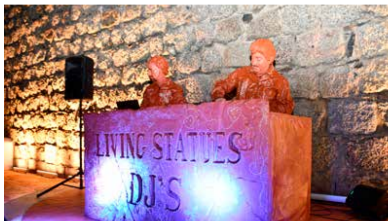
Dj's na Casa das Memórias