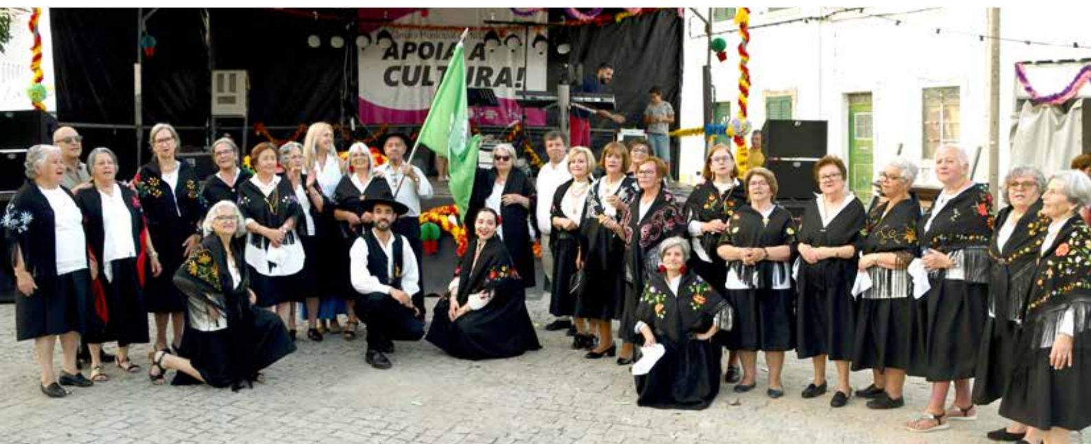
Turma de Dança da Universidade Sénior nas Marchas de Santo António

O Município de Nisa, que tem sido um parceiro fundamental na valorização das Marchas de Santo António, apoiou ativamente esta iniciativa, reforçando o seu compromisso não só a com a manutenção das tradições locais, como com a promoção de um envelhecimento saudável e participativo.