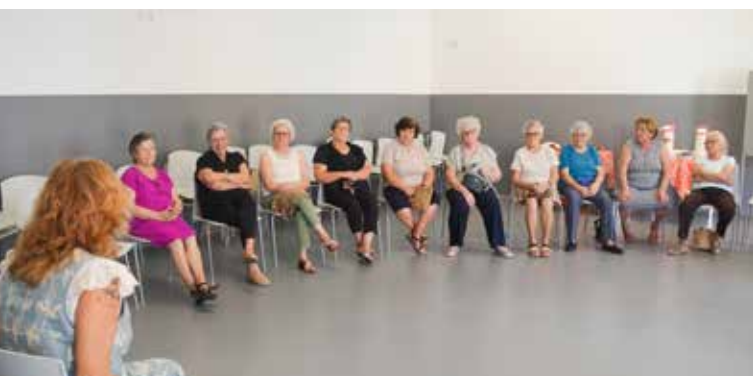
Chá com Letras em Alpalhão