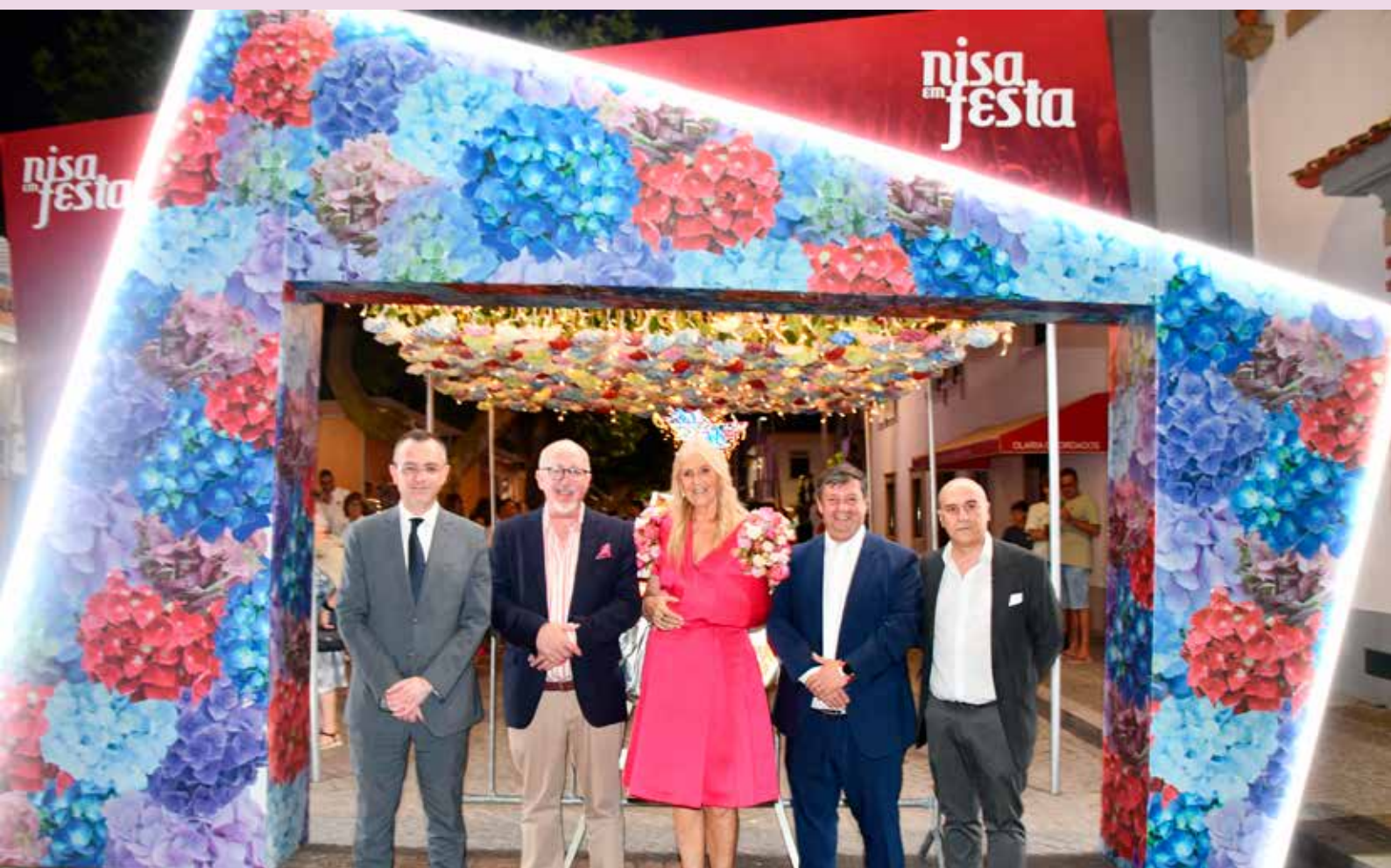
Entidades na inauguração do Nisa em Festa