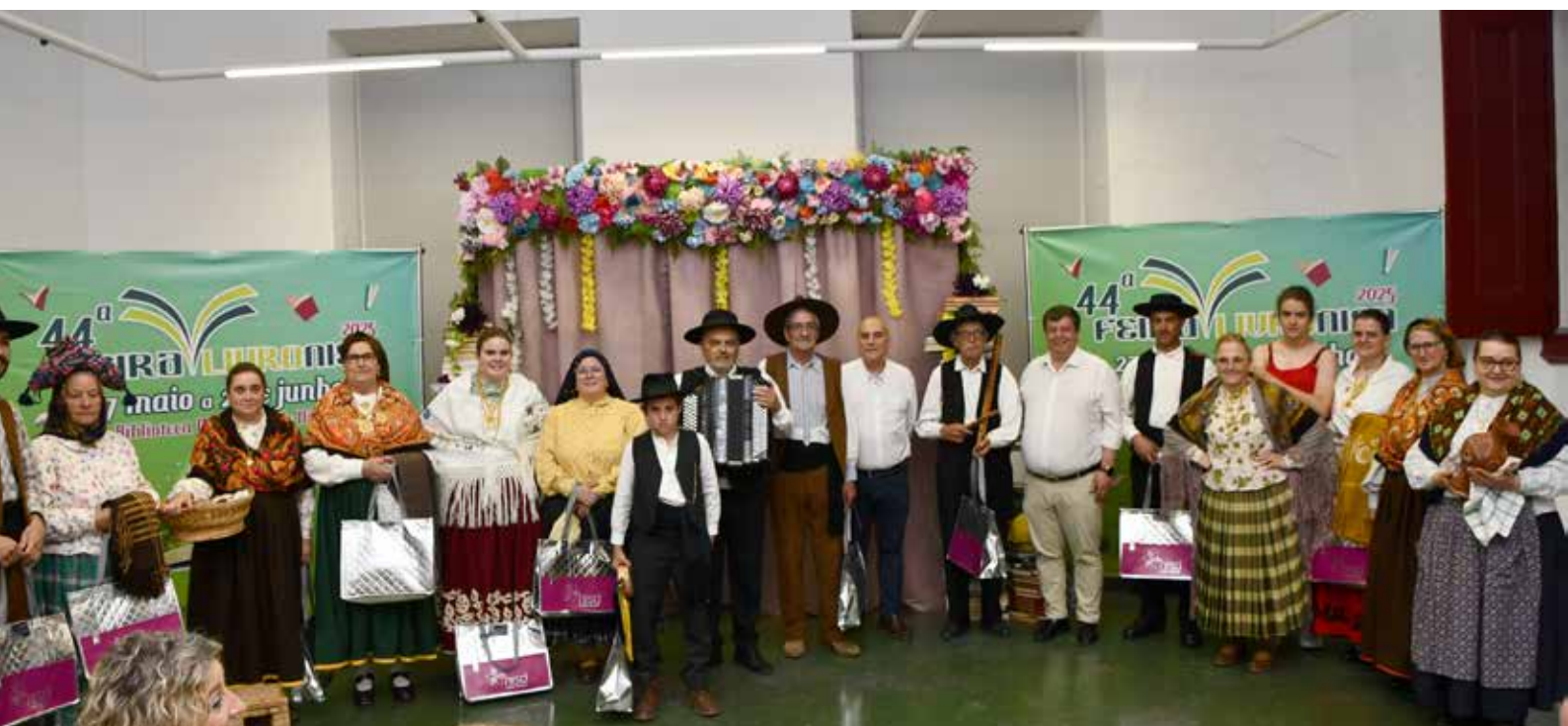
Rancho Típico das Cantarinhas de Nisa na Feira do Livro

de autógrafos, animação infantil e momentos musicais, promovendo o gosto pela leitura e o contacto direto com autores e obras, bem como o incentivo à cultura, num ambiente de proximidade e celebração.