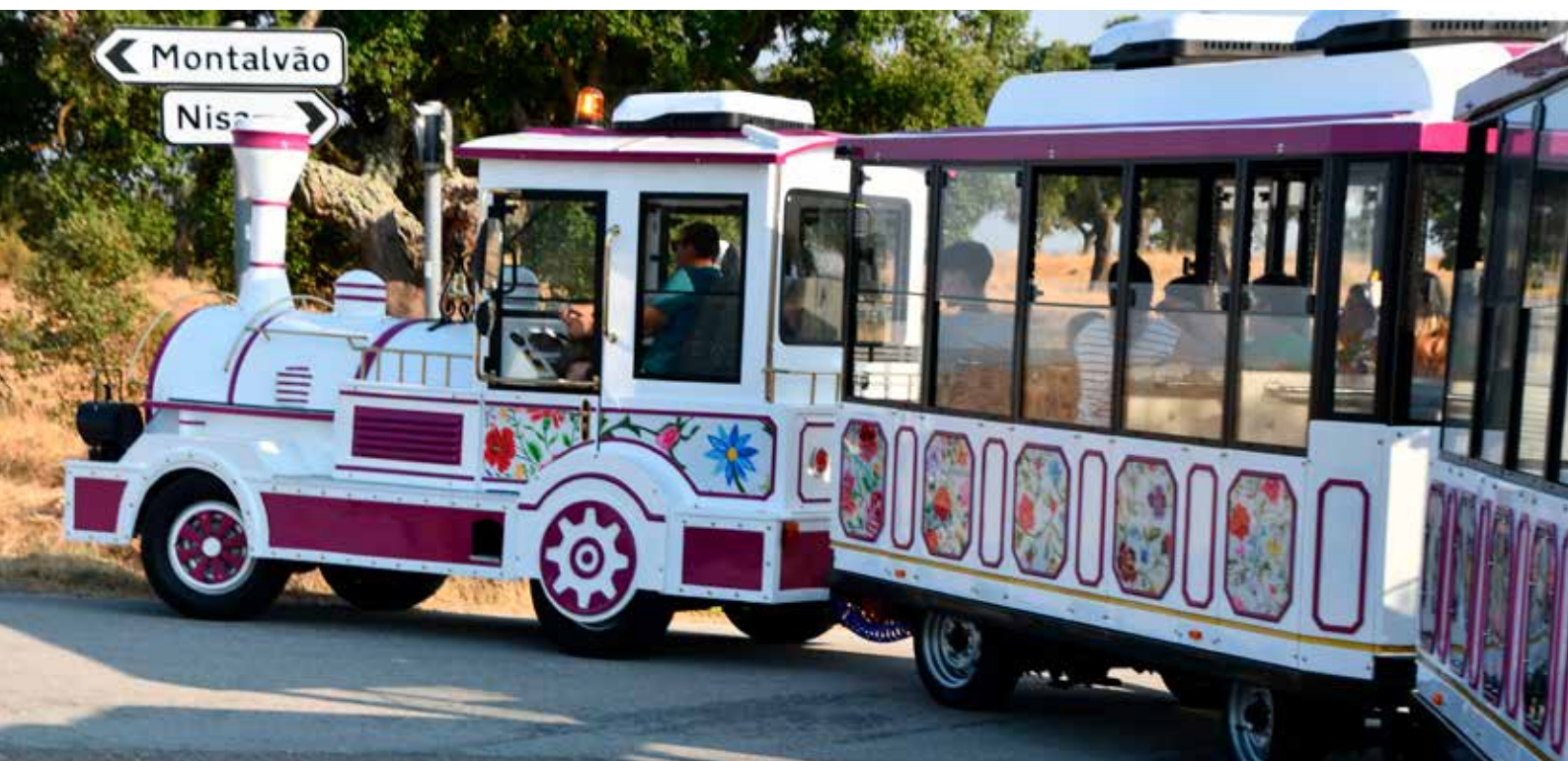
Comboio Turístico nas Freguesias

este novo equipamento reforçamos a promoção turística e cultural do concelho, dinamizando o turismo do concelho e valorizando a experiência de quem nos visita.