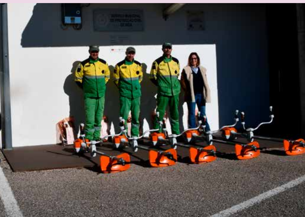
Receção de motorroçadoras para Equipa de Sapadores Florestais