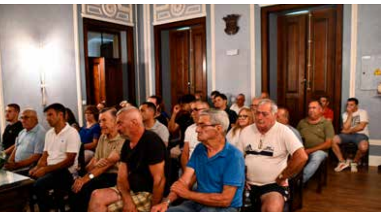
Entrega de subsídios às associações