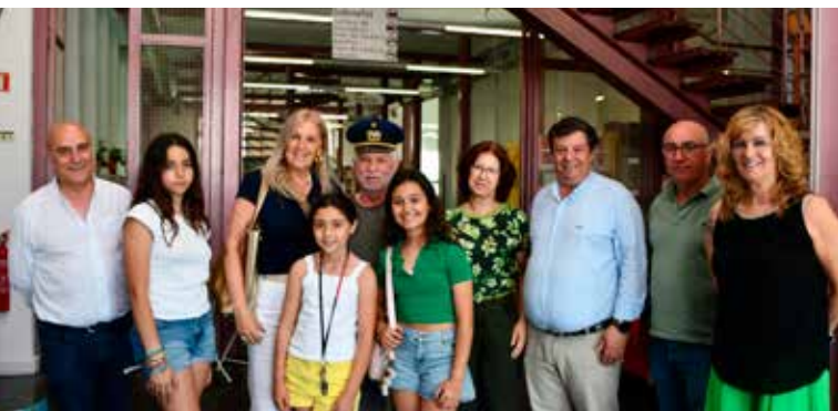
Exposição “Modelos de Aviões em Miniatura”