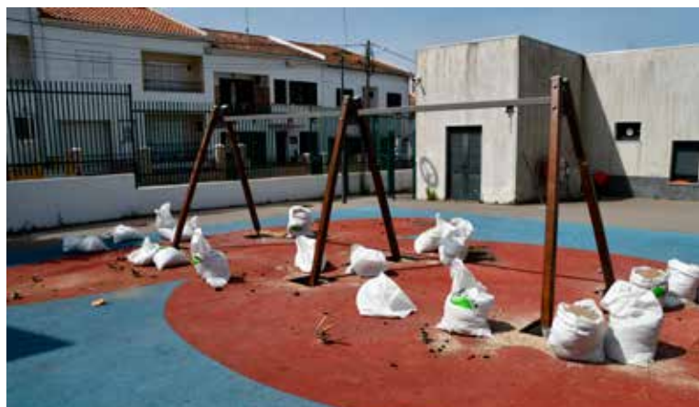
NISA – Renovação do Parque Infantil no Centro Escolar