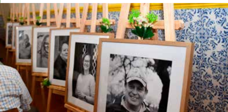
Exposição "Memórias de Permanência"