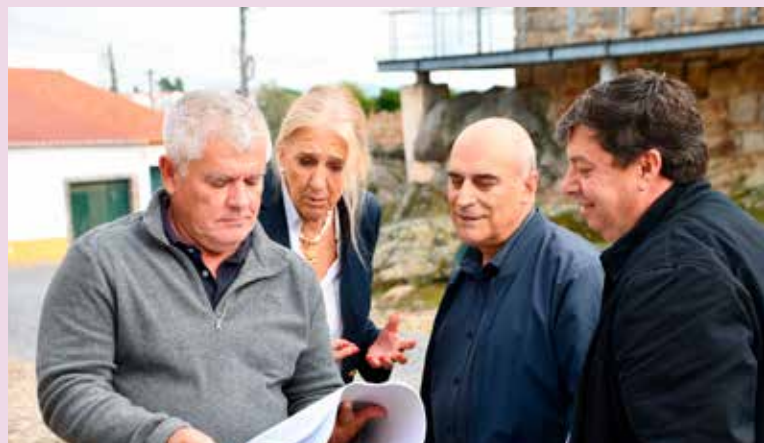
NISA – Conservação de casa junto ao Centro Histórico (105.600,00€)