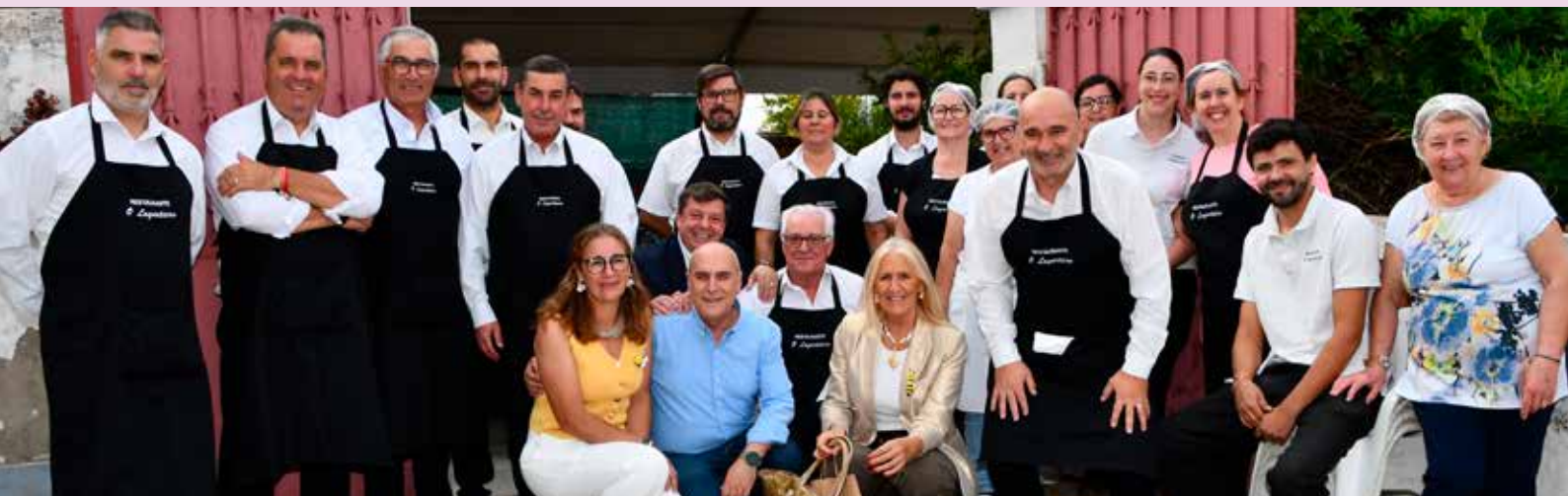
III Feira do Mel em Montalvão