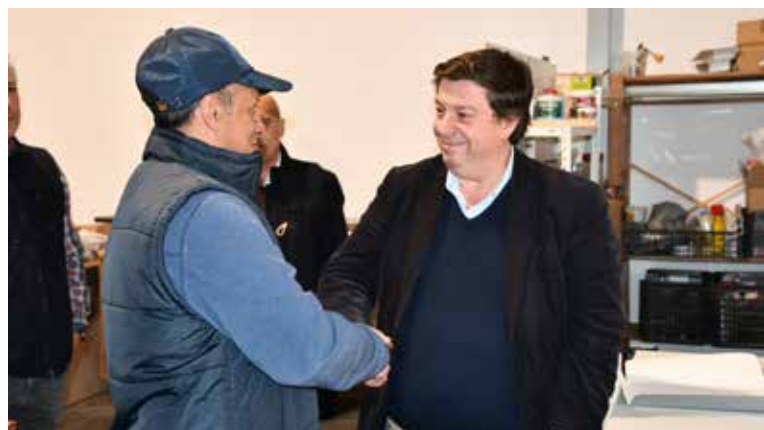
Assinatura de contrato na Incubadora de Novas Empresas (Área da Carpintaria)