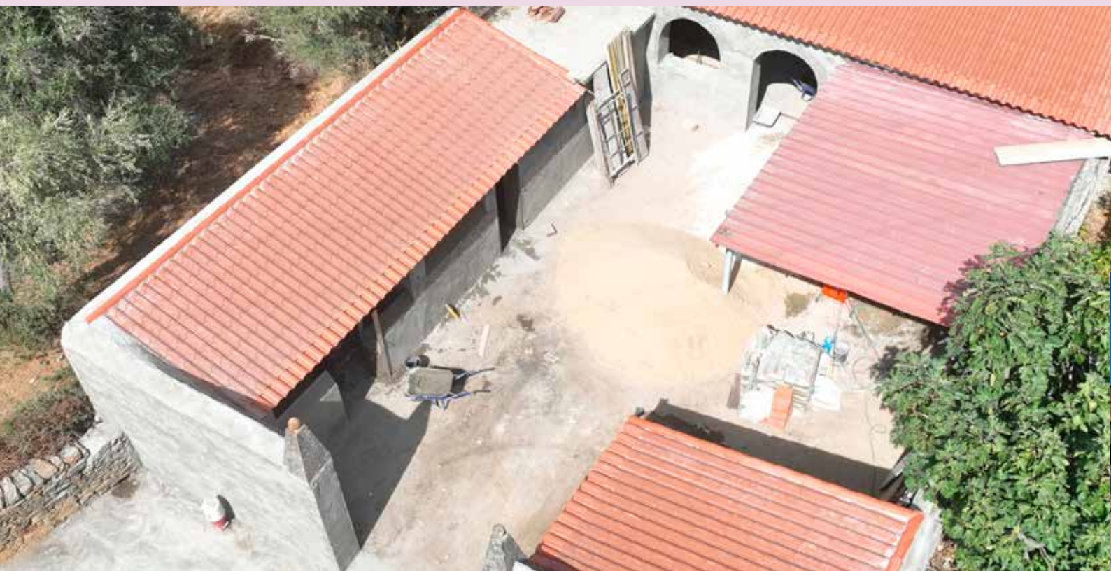
Matadouro de Montalvão Valor Contratado: 32.985,23€