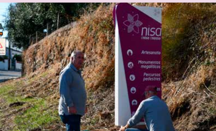
Colocação de nova Sinalética