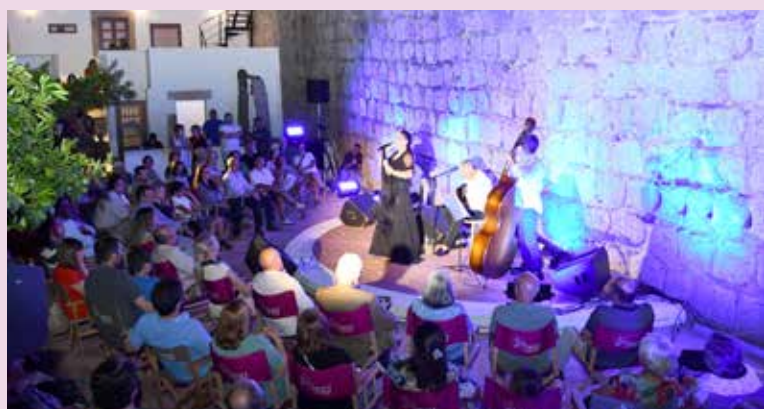
Recital de Fado na Casa das Memórias