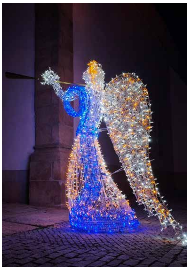
ALPALHÃO Iluminação junto à Igreja Matriz