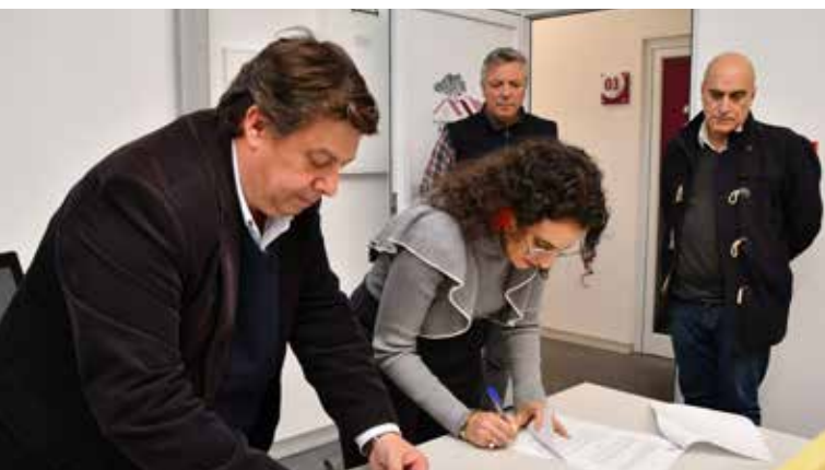
Assinatura de contrato na Incubadora de Novas Empresas (Área da Estética)