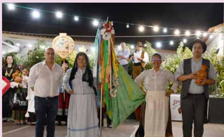
XXX Festival de Folclore de Nisa