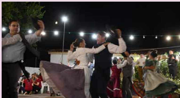
XXX Festival de Folclore de Nisa