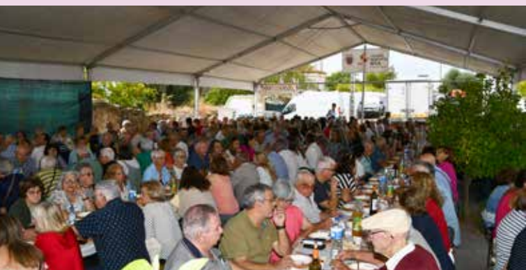
III Feira do Mel em Montalvão