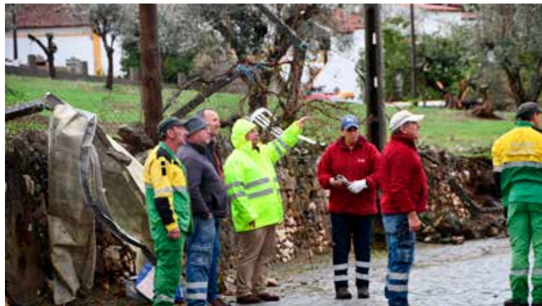
Estragos do Tornado na Falagueira

As nossas equipas removeram destroços, desobstruíram caminhos e a limpam áreas afetadas, garantindo a segurança dos residentes, e criaram soluções provisórias para proteger telhados danificados, minimizando impactos nas habitações até se avançar com reparações definitivas.