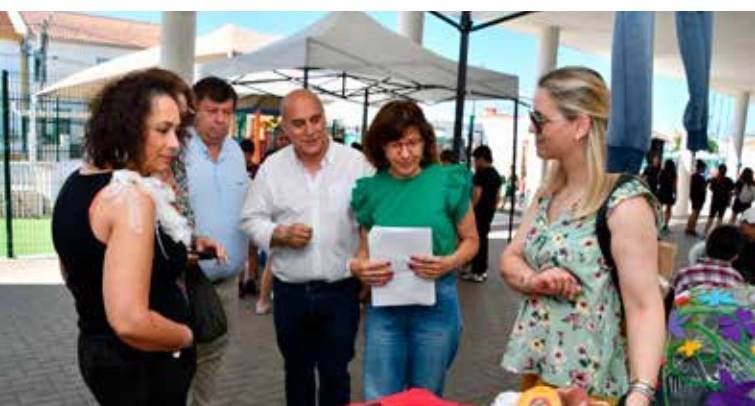
Atividades do programa EcoEscolas