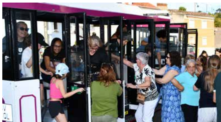
Comboio Turístico nas Freguesias Amieira do Tejo