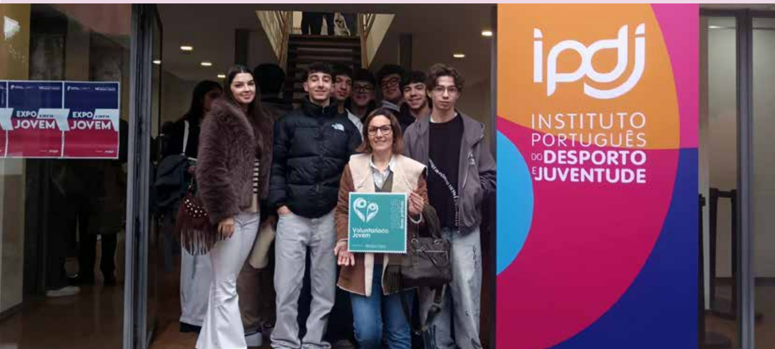
Prémio de Boas Práticas de Voluntariado

Este projeto valeu ao Município de Nisa o Prémio de Boas Práticas de Voluntariado (fase regional), atribuído pelo Instituto Português do Desporto e Juventude (IPDJ, I.P.), na categoria de entidades.