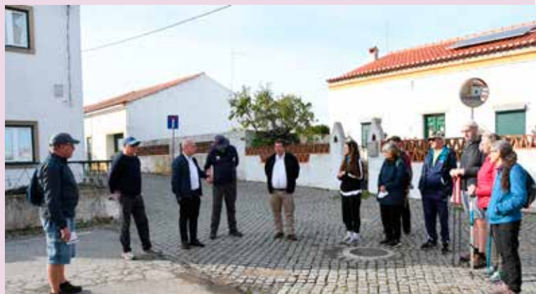
PR6 "Rota dos Açudes"