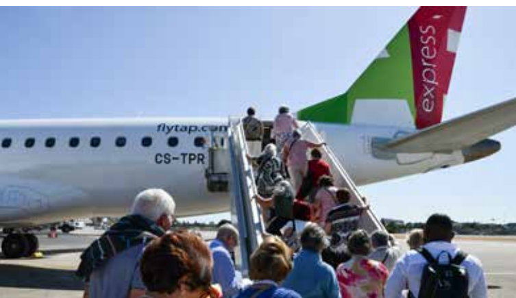
Saída do Aeroporto de Lisboa