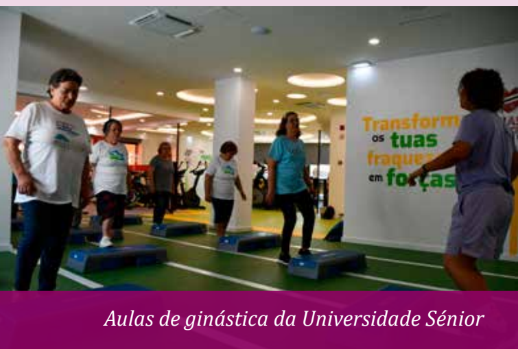
Aulas de ginástica da Universidade Sénior