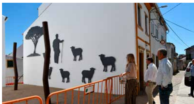
Inauguração da obra