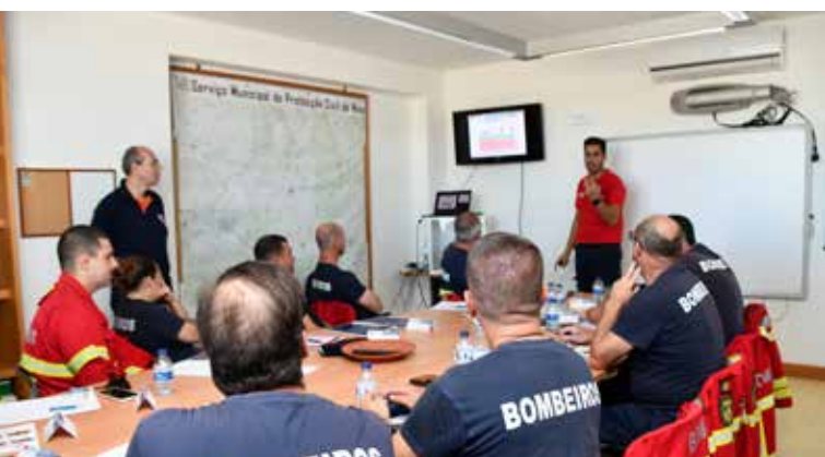
Formação com Helicóptero de Socorro