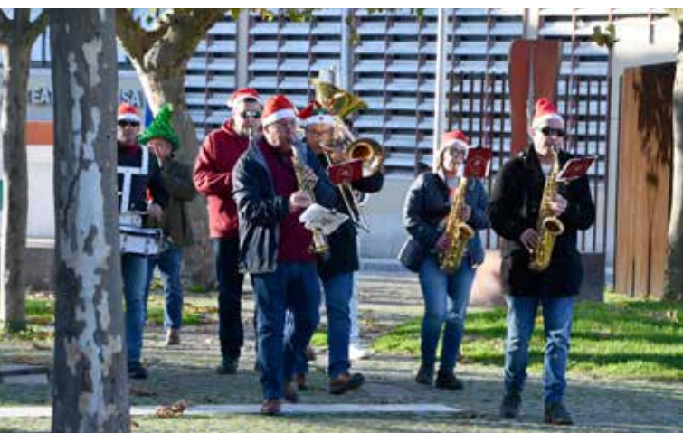
Animação de Rua Sociedade Musical Nisense