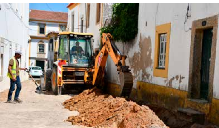
NISA – Beneficiação da Rua Capitão Vaz Monteiro