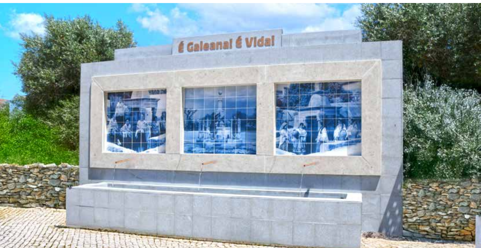
NISA - Construção de Fontanário "ÉGALEANA, ÉVIDA" Valor Contratado: 87.904,71€