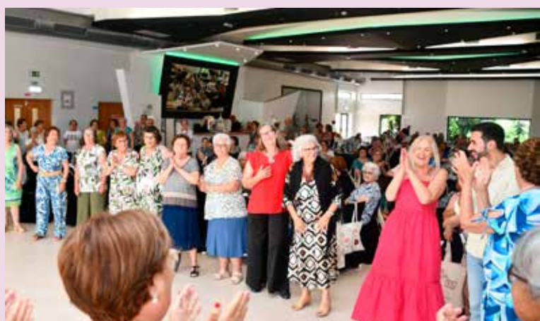
Dança e convívio