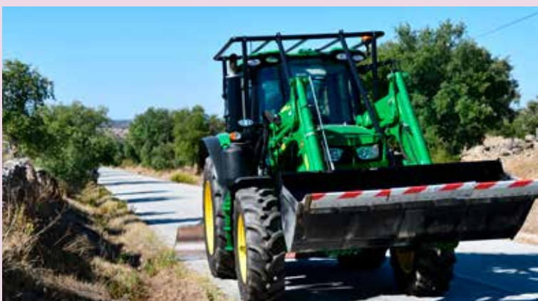
Novos equipamentos de apoio à Proteção Civil