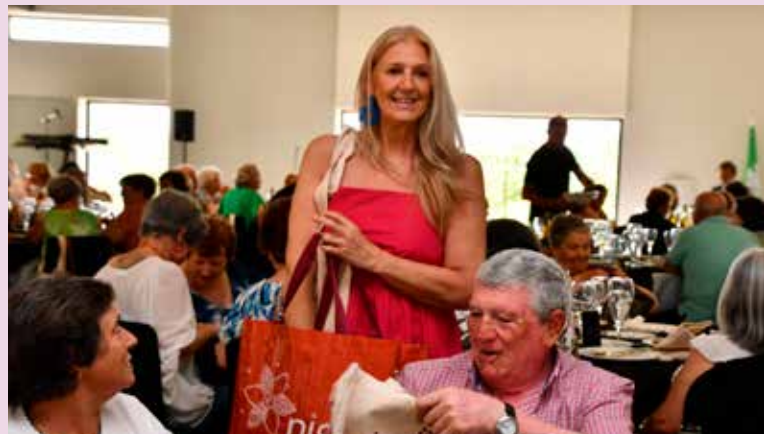
Oferta de brindes