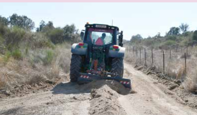
Retificação de caminho Arez - Monte Claro