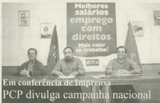
Em conferência de imprensa PCP divulga campanha nacional

A cerimónia civil teve lugar na Câmara de Azay-le-Rideau, seguindo-se um jantar